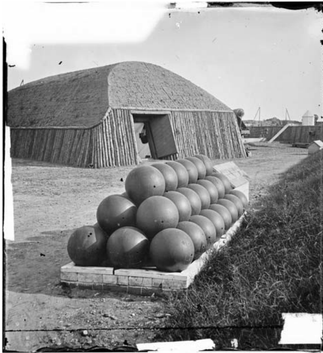
A Johnson erődben, Dél-Karolina, 1865