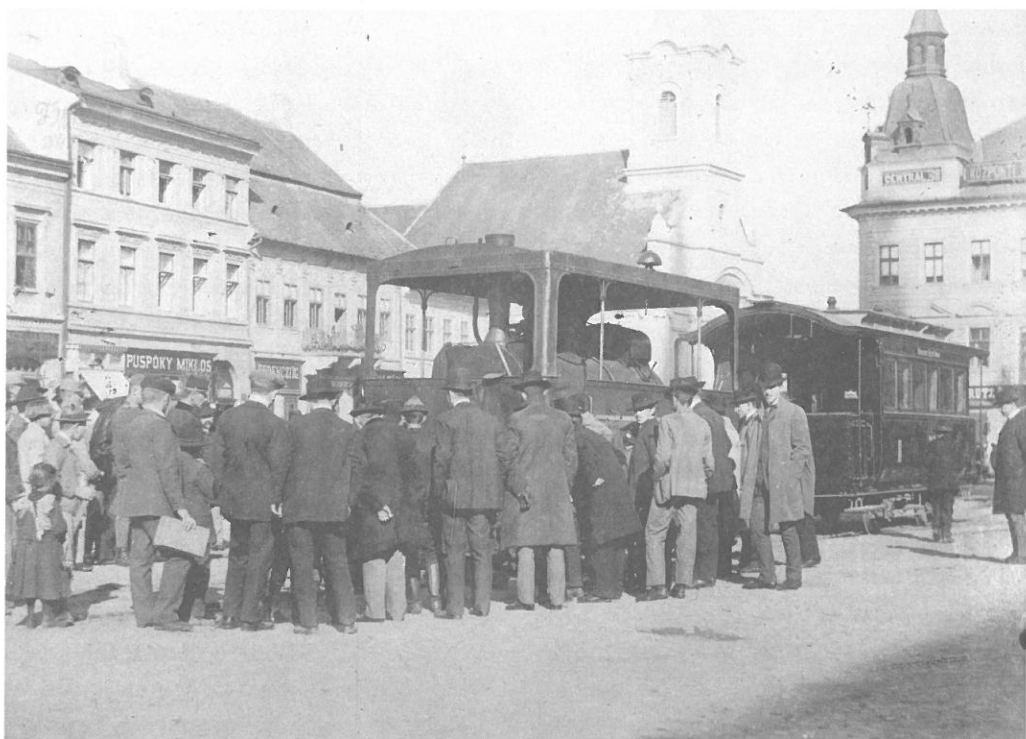
Kolozsvár, Mátyás király tér, 1910

tudja, vajon hányféle ingtag kormányformát és hány fércelt alkotmányt kellett volna elszenvednünk? Vajon miféle tisztességtelen és tehetségtelen emberek gyakorolhatták volna a főhatalmat különféle megszállók kegyelméből? S vajon mivé lett volna kezeik között az ezeréves Magyarország, amely ezekben az órákban áll meg hálaadással a jó király pannonhalmi sírja felett?