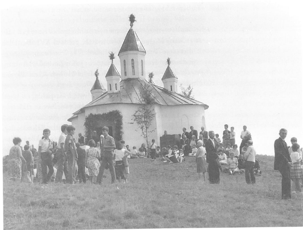
A kézdiszentlélek-perkői Szent István-kápolna, 1980-as évek

A Crisis küldetésnyilatkozatában azt írja: célja a tájékoztatáson, nevelésen át történő apostolkodás. Képezni szeretné a katolikusokat, evangelizálni a nem hívőket, és megvédeni a katolikus egyház tanítóhivatalát. Elkötelezett az egyház társadalmi tanítása iránt, amelyet azonban szerinte elsősorban az egyének és közösségek, köztes intézmények, nem pedig csupán az állam által kell megvalósítani.