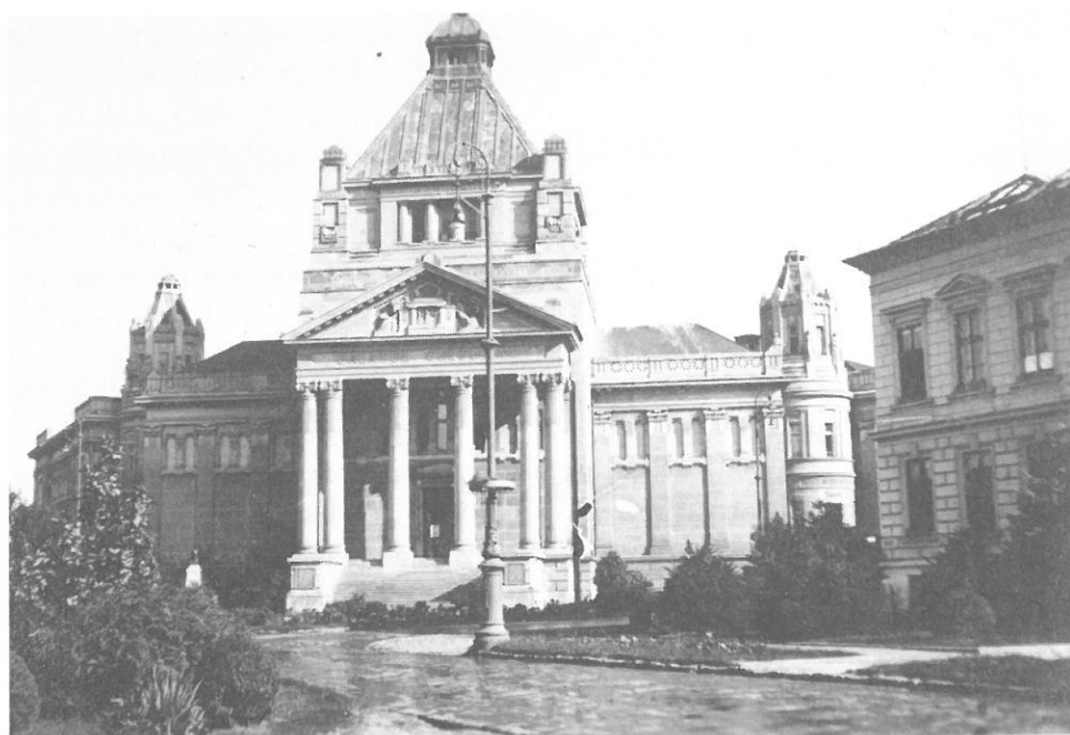
Az aradi Kultúrpalota, 1930-as évek