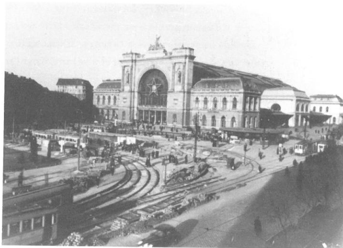
A Baross tér az 1950-es évek első felében

Nem a véletlen műve, hogy a budapesti forradalmi (később nemzetőr) csoportok azokat a tereket foglalták el, amelyek egy részét 1956-ról beszélve ma gyakran emlegetünk: ilyen például a Corvin köz, a Széna tér, a Móricz Zsigmond körtér, a Baross tér. A városi közlekedés stratégiai jelentőséggel is bíró központjai ezek. A Baross tér a VII. és VIII. kerület határán, a belváros megközelítése szempontjából fontos közlekedési ponton helyezkedik el. A főutak mellett az itt található Keleti pályaudvar tovább emeli a helyszín stratégiai jelentőségét. Említést érdemel, hogy a Rákóczi út – Baross tér – Kerepesi út vonala a Pestet megszálló szovjet különleges hadtest két hadosztályának a körzethatára volt. Pest északi része a 2. gépesített gárdahadosztály, déli része a 33. gépesített gárdahadosztály hadművelleti területe volt.