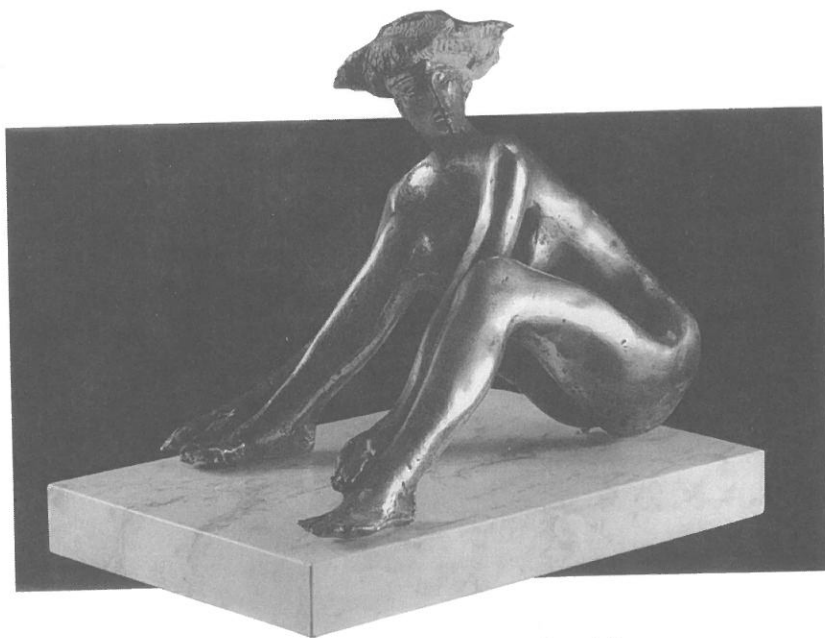
Terpeszben ülő (1990, bronz kispasztika)

A bevándorlásellenesség magas mértéke magában hordozhatná egy radikális párt esetleges sikerességét – amit az is elősegítene, hogy a mainstream pártok érdemben nem beszélhetnek a témáról. Ám jelenleg úgy tűnik, hogy sem egy új párt megjelenésére, sem a BNP hatalomra kerülésére nincs esély, legfeljebb minimális erősödéssel számíthatunk. „Hiszen toleráns az országunk, már bevándorlók számos hullámát integráltuk.” 40