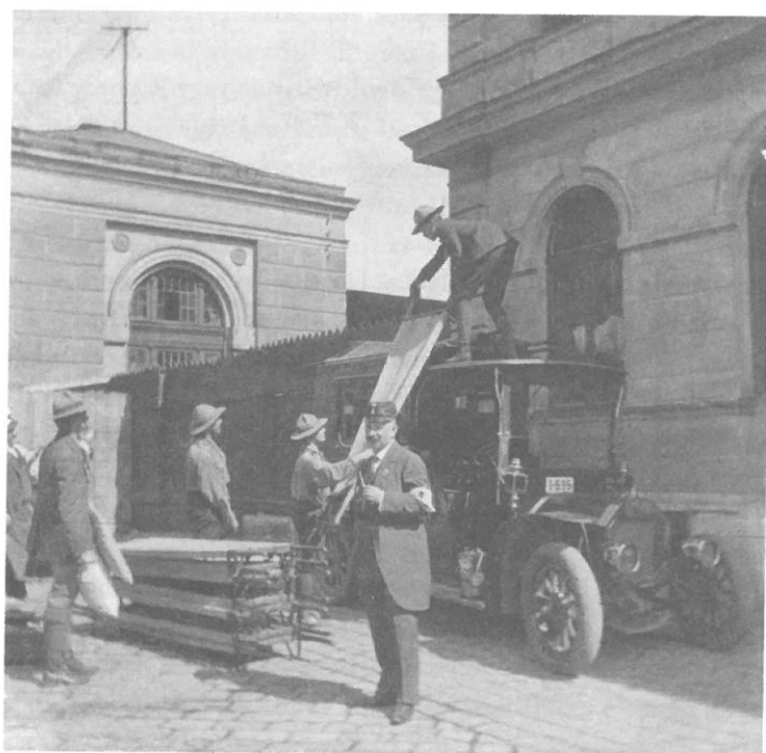
A Keleti pályaudvarnál mentőszolgálatot teljesítő cserkészek (1914 szeptembere)