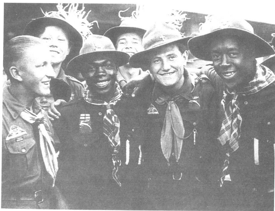
Magyar és afrikai cserkészek a '33-as gödöllői dzsemborin