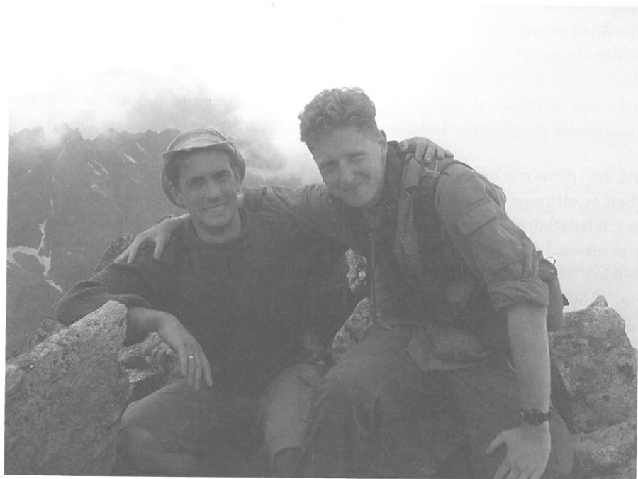
Belga–magyar cserkésztestvériség a MagasTátra egyik csúcsán (2004)