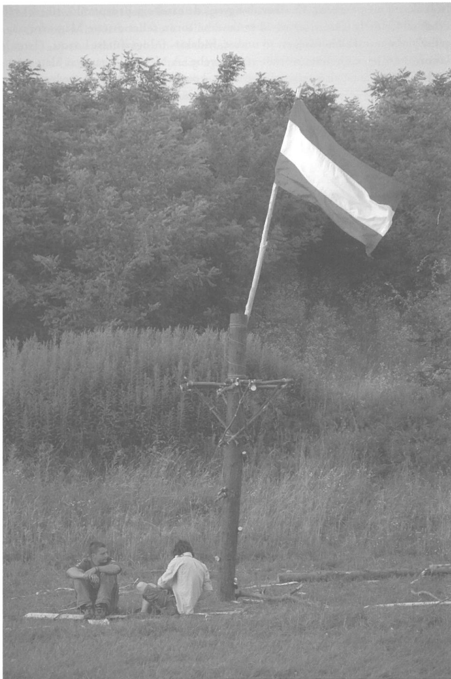
Zászlórúd és magasles a 2010-es I. cserkészkerületi nagytáborban