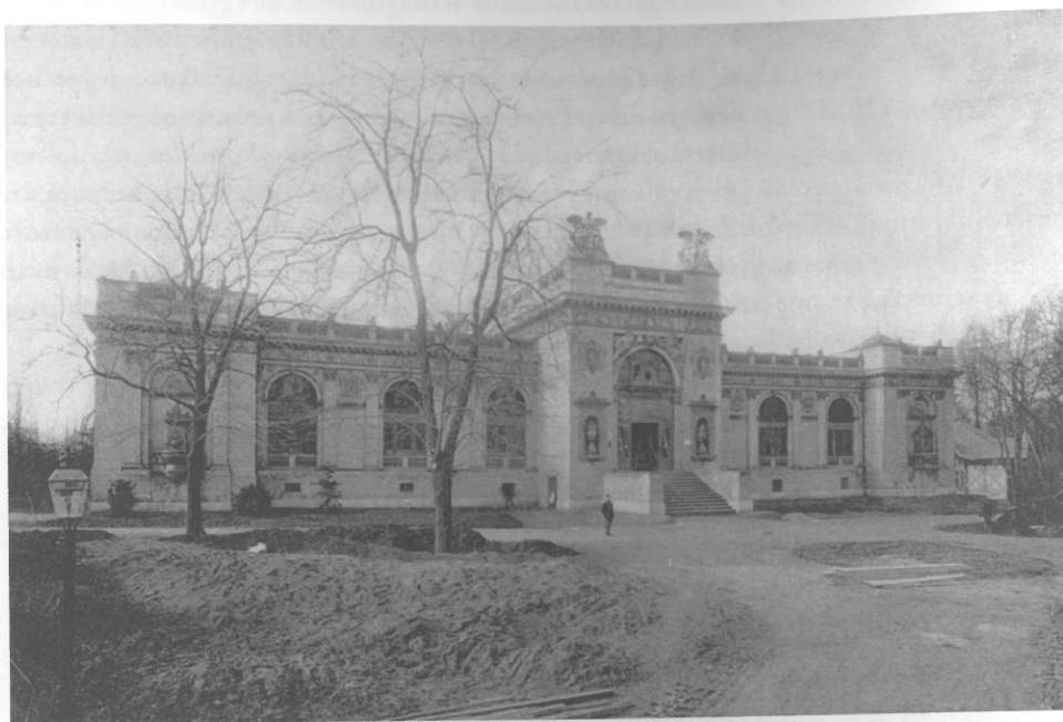
Az ezredévi kiállításra épült Műcsarnok 1900-ban (ma Magyar Alkotóművészek Háza az Olof Palme sétányon)