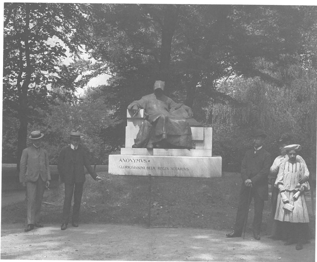
Anonymus szobra (Ligeti Miklós alkotása) 1903-as felavatása után

találjuk. Fel kell tennünk – nem egyszer, sokszor – magunknak és egymásnak az alapvető kérdést: milyen rendet akarunk? Milyen játékszabályokra akarjuk építeni a nemzeti közösségünket? S ezen belül hangsúlyosan: milyen szerepet szánunk e közösségen belül a kormánzatnak? Valóban könnyű szívvel elvethetjük mindazt a negatív európai tapasztalatot, amely a plebejus etatizmushoz tapad? Valóban nem kell gondosan ápolnunk a hatalomkorlátozás eszméjét s intézményeit? A nemzeti önállóság évszázados hiánya mintha elhalványította volna bennünk azt a mélyen európai, mélyen keresztény érzéket, hogy a politikai hatalom csak határozott korlátok közé szorítva szolgálhatja az ország javát. „Zsarnokaink a népszennvedélyekkel ügyesen kacérkodni tudó kortesvezetők” – aggodott jó másfél százada Széchenyi. 18 Aggodalmát ma is komolyan kéne vennünk.