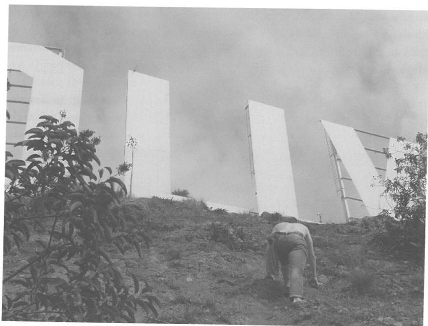
Tilosban járva, úton a jel felé (Hollywood Hills, California)