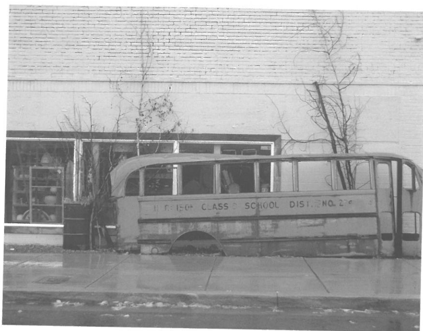
Utcakép (Walla Walla, Washington)