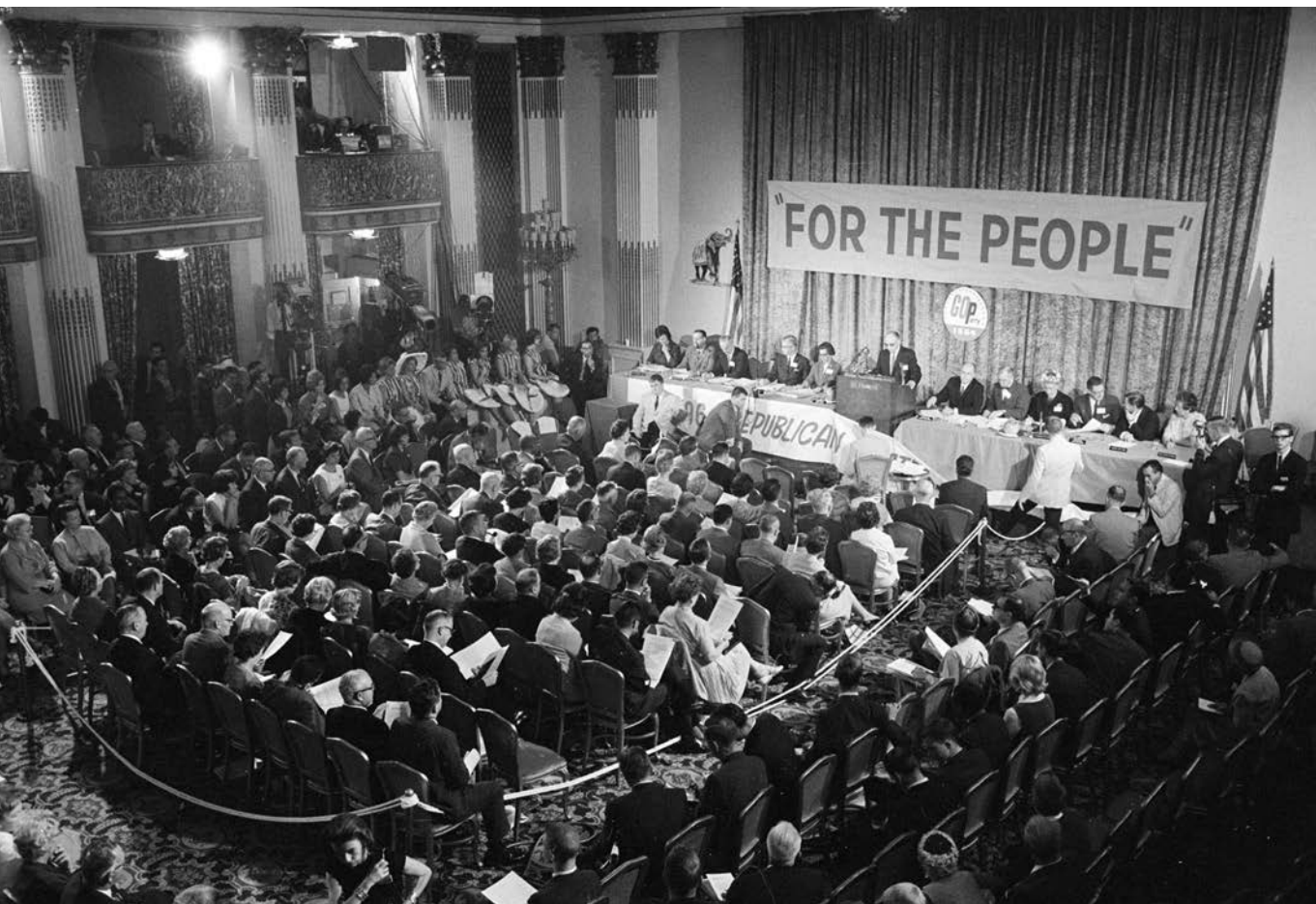
A nép pártján – Republikánus nemzeti konvenció 1964 júliusában

azt államtalanítani kell.” 1 Ez az anarchisztikus-libertárius felfogás a hatalmat elvonná az államtól, de az uralom struktúráit továbbra is üzemeltetné, mégpedig kevésbé látható és elszámoltathatatlan globális szerveződések (transznacionális vállalatok, nemzetekfölötti intézmények, föderális bíróságok, NGO-k) segítségével. Az ilyen és ehhez hasonló, naivan utópikus elképzelések mellett persze sokkal átgondoltabb elméletek és nemritkán fölfegyverzett gyakorlatok is léteznek a politika megsemmisítésére vonatkozóan; amelynek első lépése a jobb- és a baloldal közötti különbség eltagadása, semlegesítése és feloldása szokott lenni. De a semlegesség nem semleges, az ideológiamentesség maga is ideológia.