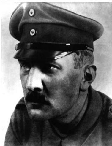
Arthur Moeller van den Bruck (1876–1925) az I. világháború végén