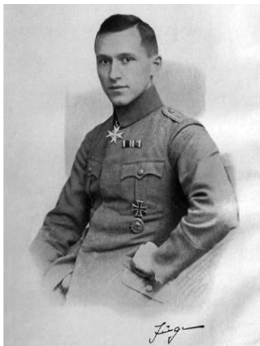
Ernst Jünger (1895–1998) 1921-ben