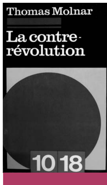
Az ellenforradalom (1969)