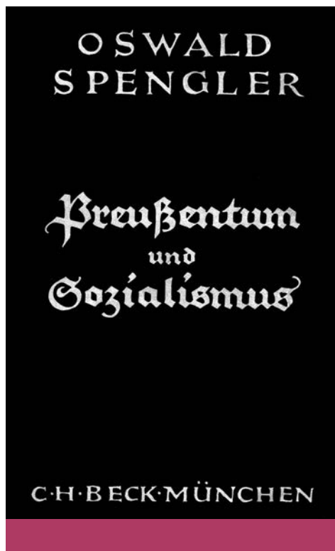
Poroszság és szocializmus (1919)

4) Az életfilozófiákban – ahová Spengler is tartozik – kezdettől fogva nagy szerepet kapott az a gondolat, hogy az élet mint a létezés eredendő anyaga hogyan fejleszti ki magából a számára megfelelő formákat . Ez már Nietzsche korai művében ( A tragédia születése ) világosan megmutatkozik, amidőn a dionüszoszi oldal (a mámor módozatában az élet ősanysága ) megteremti magának az apollóni oldalban az adekvát formákat. Wilhelm Dilthey ugyanígy járt el a szellemtudományok metodikájának kidolgozása során; nem véletlenül tulajdonított akkora jelentőséget a kifejezésnek mint formaadó elemnek. Simmel hasonlóképpen fogta fel az élet és az általa megvalósított formák sajátos életdialektikáját, azt, hogy az életnek egyszerre van szüksége a formákra és azok meghaladására: „Mivel élet, szüksége van formára, és mivel élet, többre van szüksége, mint a forma. Ez az ellentmondás jellemzi az életet: csak a formákban található védett helyre, de egyetlen forma sem nyújt menedéket, – tehát minden általa létrehozottat meghalad és szétör.” 15 Ez az életből kifejlesztett kettősség a spengleri kultúrmorfológiára is rávetíthető; e szempontból a kultúra – egy cikluson belül – azt a fázist jelenti, amelyben a történeti élet megleli és megalkotja a számára adekvát formákat, a civilizáció pedig azt a fázist képviseli, amelyben a formák bizonyos mértékig külsővé, művivé, idegenné válnak.