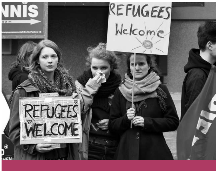
A Nyugat alkonya – A Willkommenskultur jegyében tüntetők Berlinben, 2014

gondoljuk, hanem legalább ezer évvel előtte jár. S e szempontból nem az al-Kaidára vagy az Iszlám Államra kell gondolni, amelyek pszeudovallások, s hamar el fognak tűnni, hanem az anatóliai vagy Nílus-parti jámbor muszlimok millióira, akiket a Nyugat minden fáradozása ellenére sem sikerült „felvilágosítani”. Majd hozzát teszi: mindez nyilván egyike a Spengler-olvasatoknak, de nélküle is el lehet jutni hasonló végkövetkeztetésekhez.