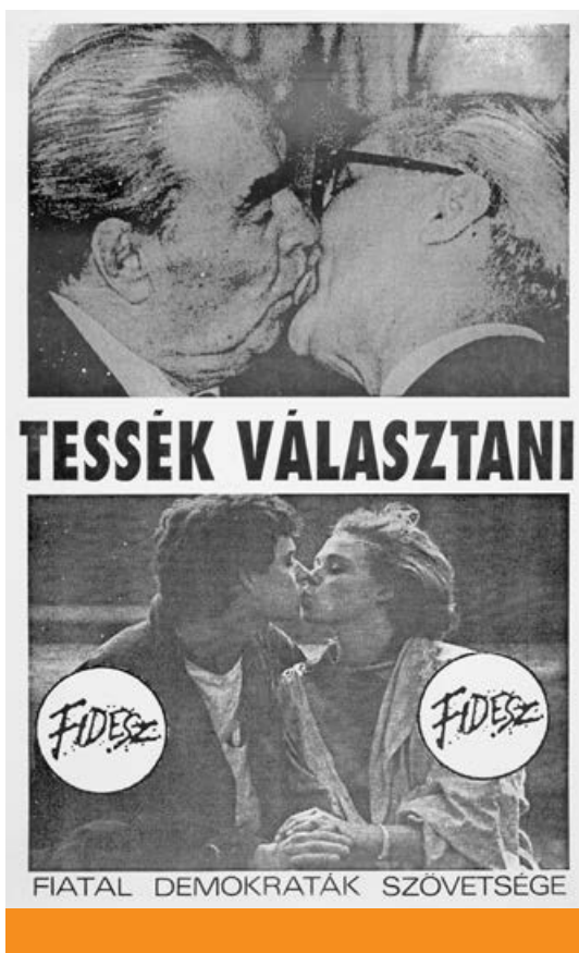
A Fidesz választási plakátjai 1990 tavaszán (Terror Háza Múzeum)

ség mára elveszítette hegemon szerepét, és részben kikerült a zsűri szerepéből, ahonnan előszeretettel ítélkezett (és ma is ítélkezik) a demokratikusan választott politikai vezetők, sőt maguk a választók felett is.