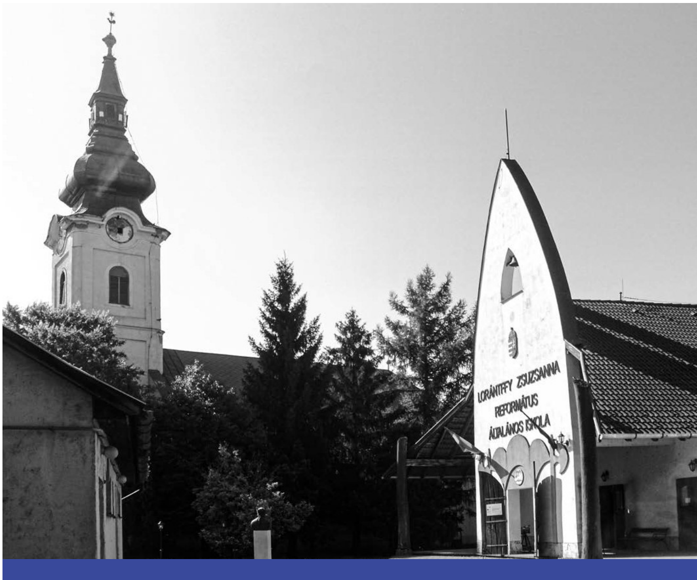
A templom és az iskola – Tiszakeszi központja 2019 nyarán

mégsem terhelő alkalom egy pontján bárki előremehet, bizonyosságot tehet egy megértett hitigazságról, lelkesítheti, intheti a testvéreket, és főleg éneket kérhet, amit aztán a szintetizátorossal és a csoporttal együtt énekel. Milyen megdicsőültté válik egy kócos anyuka, mikor három percre dicsőítést vezet, mikrofonba énekelve azt a lassú dalt, ami legjobban kifejezi hitérzetét: „A te keneted járjon át engem! / A te Szellemed érzem én...” Talán ez a legerterjedtebb roma környezetben született hitének. Klipje alatt a Youtube-on véget nem érnek a helyesírási hibákkal teli, elérzékenyült hozzászólások, sejtetve, valahol a mélyben mennyi cigány lett átélten keresztyénné minálunk.