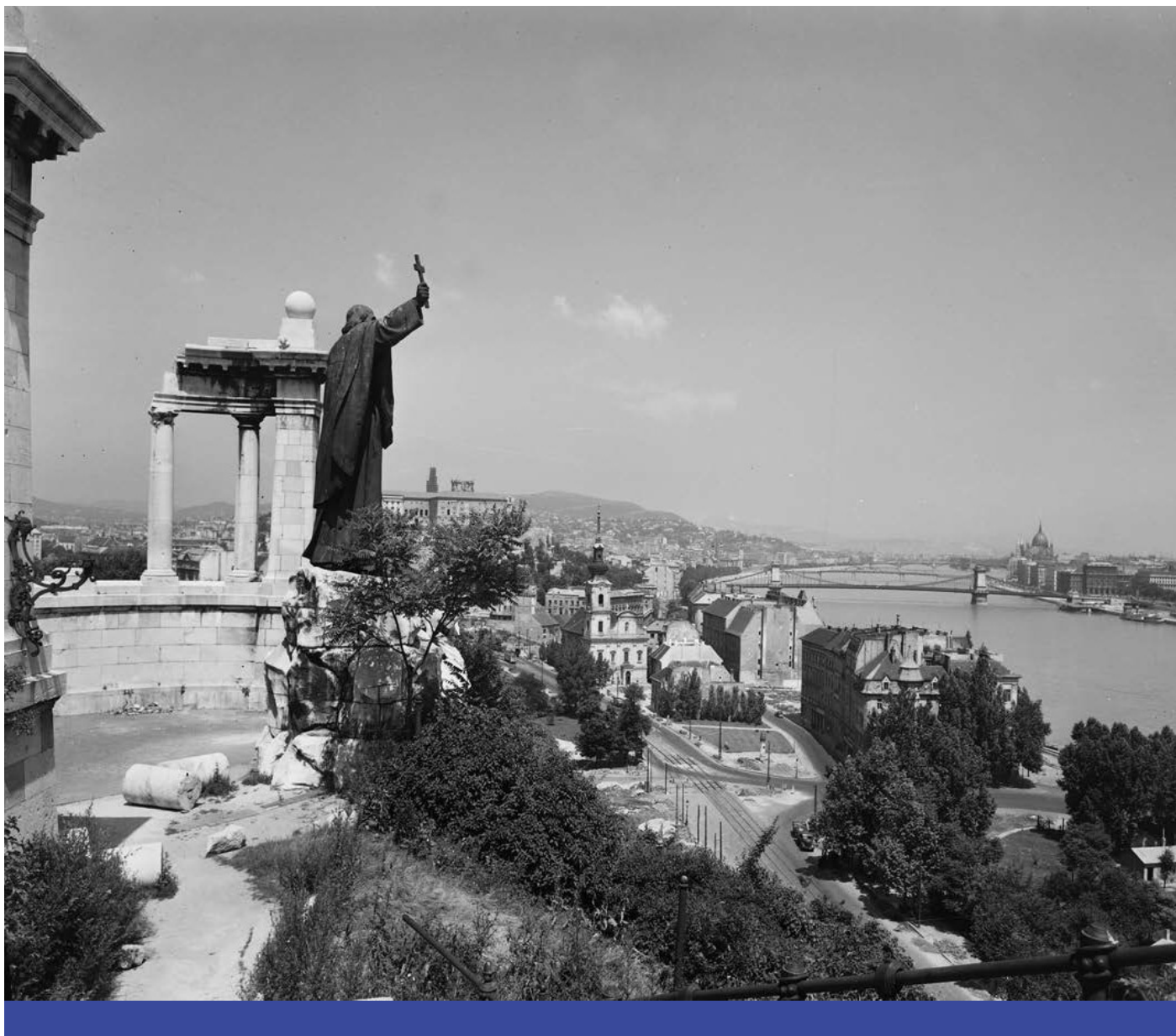
E jelben – Kilátás a Gellért-hegyről, a Szent Gellért szobortól a Lánchídra, 1955

Először is biztosra vehető, hogy közvetlenül vagy közvetetten, de a nyugati gondolatvilágot évszázadok óta formáló politikai struktúrával az előbbieken felvázolt alkotmány jobban összhangban áll, mint a jelenleg működő, teljesen mesterséges intézmények. Ezeknek a történelmi struktúráknak és értékeknek az újjáéledése nemcsak az új Európai Unió erősebb tudatalatti felfogását, valamint a hozzá fűződő szorosabb lojalitást hívja életre, hanem sokkal alkalmasabbnak tűnik azoknak a történelmi kihívásoknak a kezeléséhez is, amelyekkel a civilizációnk hamarosan szembesülni fog. Attól a pillanattól kezdődően, amikor az európai embereknek már nem Európa évszázados hagyományaival ellentétes ideológia által éltetett mesterséges struktúrák, hanem a legtávolabbi múltba visszatekintő politikai intézményeket és elképzeléseket elfogadó politikai entitás ad irányutatást, úgy alappal feltehető, hogy döntéshozatali erejük, valamint ellenállóképességük jelentős mértékben meg fog erősödni.