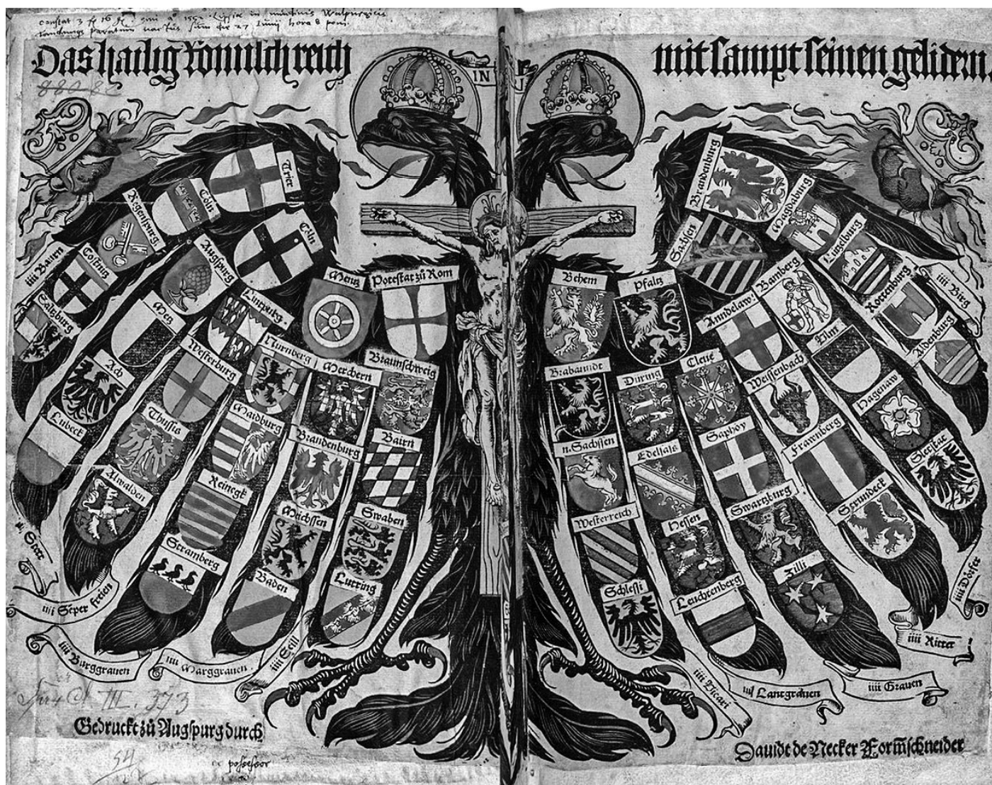
Sacrum Imperium – A Szent Római Birodalom államainak címerai 1510-ben