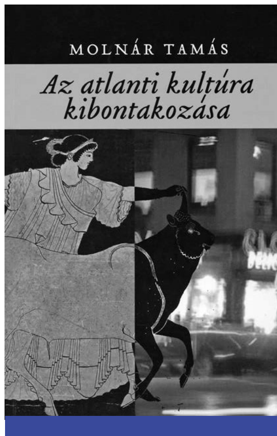
Molnár Tamás: Az atlanti kultúra kibontakozása ([1994] 2006)

Molnár Tamás szerint inkább egy felülről vezérelt egyesítés kísérlete érhető tetten az eseményekben. „Európa, amely sosem volt egységes, mindig is a legtermészetesebb kísértést jelentette a föderátorok számára, akiket manapság – a most uralkodó ideológiának megfelelően – az »egyesítő« váltottak fel. Ez nem valamiféle új dolog. A szabályokat már a két »Róma«, a birodalom és az egyház kidolgozta, következésképp majd' két ezredév történelméről van szó. A föderátorok kevesen voltak, de nagy hatalommal bírtak: Nagy Károly, a római-germán császárok Ottótól V. Károlyig, Napóleon, Hitler. A föderáció törekvése három eszméből táplálkozott: az univerzalista római katolicizmusból, az észak-déli tengely mentén kibontakozó birodalmi eszméből (Németország nyomulása a Földközi-tenger felé), s a forradalmi-jakobinus eszméből