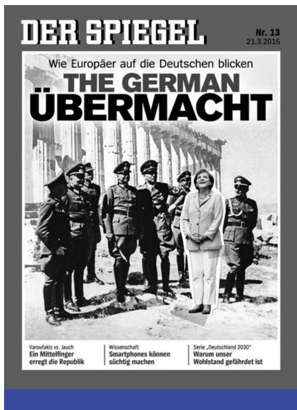
Német Európa – A Der Spiegel 2015-ös Merkel-címlapja

A 2011-es ún. „arab tavasz” jórészt felszámolta Moszkva befolyását a Földközi-tenger medencéjében a szövetséges rendszerek megdöntése révén, nem csoda tehát, hogy Oroszország – latakiai támaszpontja védelmében – az Aszad-rendszer oldalán beavatkozott a szíriai polgárháborúba. További konfrontációra adott alkalmat a nyugati szövetségi rendszerrel a 2014-ben kitört ukrajnai polgárháború, hiszen annak kitörésére az adott okot, hogy Ukrajna új vezetése