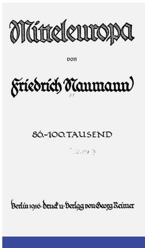
Friedrich Naumann: Mitteleuropa (1916)

Molnár ezért úgy látja, hogy „a szokásos rózsaszín szemüveget [...] félre téve látszik, hogy az Európai Gazdasági Közösség a német hegemonizmust kielégítve zsákutcába tart [...] a rendkívül problematikus gazdasági egyesítést nem fogja a kontinens politikai egyesülése kísélni” (67). Emlékeztet Max Weber 1916-os megjegyzéseire, „amelyben figyelmeztette Németországot London, Párizs és Moszkva hegemoniaigényére (Washington nem létezett politikailag). A weberi perspektívában Németországnak központi pozícióját kell használnia ahhoz, hogy szövetségese legyen a kis nemzeteknek, a francia, az angol vagy az