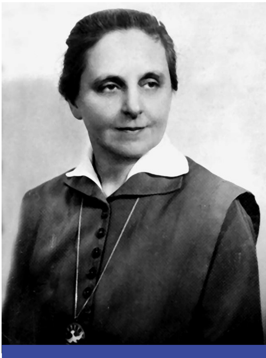
Slachta Margit (1884–1974)

ezt a finom, gyengéd, zseniális lányt, igazi finom lélek; csak nagyon radikális, és az alacsonyabb néposztályok életmódját és szokásait könnyen felveszi, például roppant igénytelen, mindennel beéri, földön is elalszik.” 8 Márciusban előbb lakóhelyének választókerületében aratott első győzelmet, majd e hónapban a magyar nemzetgyűlés első női képviselője lett. Ezt a tisztséget 1922. február 16-ig töltötte be, összesen 28 beszédet tartott a Házban.