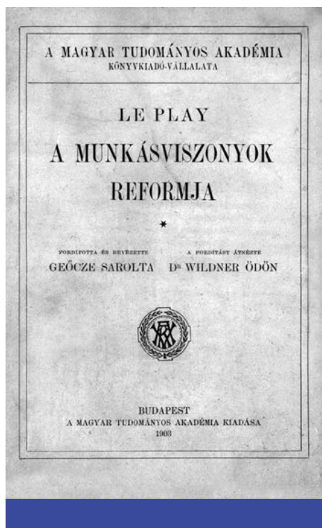
Frédéric Le Play: A munkásviszonyok reformja ([1870] 1903)

katolikus – konzervatív körök foglalkozni az ipari kapitalizmus égbe kiáltó bűneivel. Aligha volt ugyanis tagadható, hogy a kapitalizmus kialakulásának története az embertelenségek katalógusaként is olvasható, berendezkedése pedig mindenütt a hagyományos közösségek elpusztításának árán valósult meg. Az 1871-es kommün következtében mélyült el az a konzervatív meggyőződés, hogy a polgári liberális rendszer ellenében a néphez kell fellebbezni , és azt sem szabad hagyni, hogy a burzsoázia a munkásságot végleg a – kapitalizmus-hoz hasonlóan – nemzetközi szocialista mozgalom karjaiba kergesse. A Rajnától nyugatra René Tour du Pin márki, Albert de Mun, Émile Durkheim és a tudományos szociológia alapjait megteremtő (Saint-Simon-tanítvány) Frédéric Le Play volt az úttörő. (Utóbbi készítette egyébként Magyarországról az első szerző sociográfiát, amikor 1846-ban átutazott a Tiszamen-tén. 6 ) A Rajnától keltre Lorenz von Stein, Wilhelm von Ketteler mainzi püspök (akinek A munkások kérdése és a kereszténység című műve már a megjelenését követő évben, 1864-ben kijött az egri püspökség nyomdájából) és az ún. katedraszocialisták (Rudolf Herman Meyer: Emanzipationskampf des viertes Standes , 1875). 7