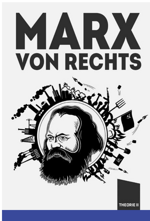
Marx jobbról (2019)

Mindezekkel a folyamatokkal azok is tisztában vannak, akik a marxizmus százötvenéves szöveghagyományát figyelmen kívül hagyva akarják kinyerni a marxi életműből azt, ami egy nemzeti antiglobalizációs gondolkodás számára hasznosnak bizonyulhat belőle. Számukra készült a Marx jobbról című kötet, benne a már említett Kaiser, a Nouvelle Droite alapító teoretikusa, Alain de Benoist és a magát „párt nélküli szocialistának, egyház nélküli kereszténynek” nevező, olasz szuverenista Diego Fusaro tanulmányaival. 34 A kötet célja, hogy olyan jobboldali Marx-olvasatot adjon, amely egyfelől ismeri és használja a kapitalista világrendszer marxi elemzésének ma is érvényes megállapításait (a globalizáció mint a „fiktív kapitalizmus” legfelsőbb foka, árufetisizmus, elidegenedés, hegeli ontológia), másfelől felismeri, hogy a liberális-baloldali mésalliance idején – amikor is sajátos Linkskapitalismus születik az antifasiszta konszenzust rózsaszínűben fenntartó multikulturális baloldal és a multinacionális neoliberalizmus vérfertőzéséből – lehetőség van arra, hogy „a politikai jobboldal Marxot mint gondolkodót újraértékelje, s eközben radikális kritikáját is elsajátítsa”, hogy aztán egy ebből születő „jobboldali antikapitalizmus politikai gyakorlata képes legyen elindítani a neoliberalis jobboldal és a mai baloldal végének kezdetét”. 35