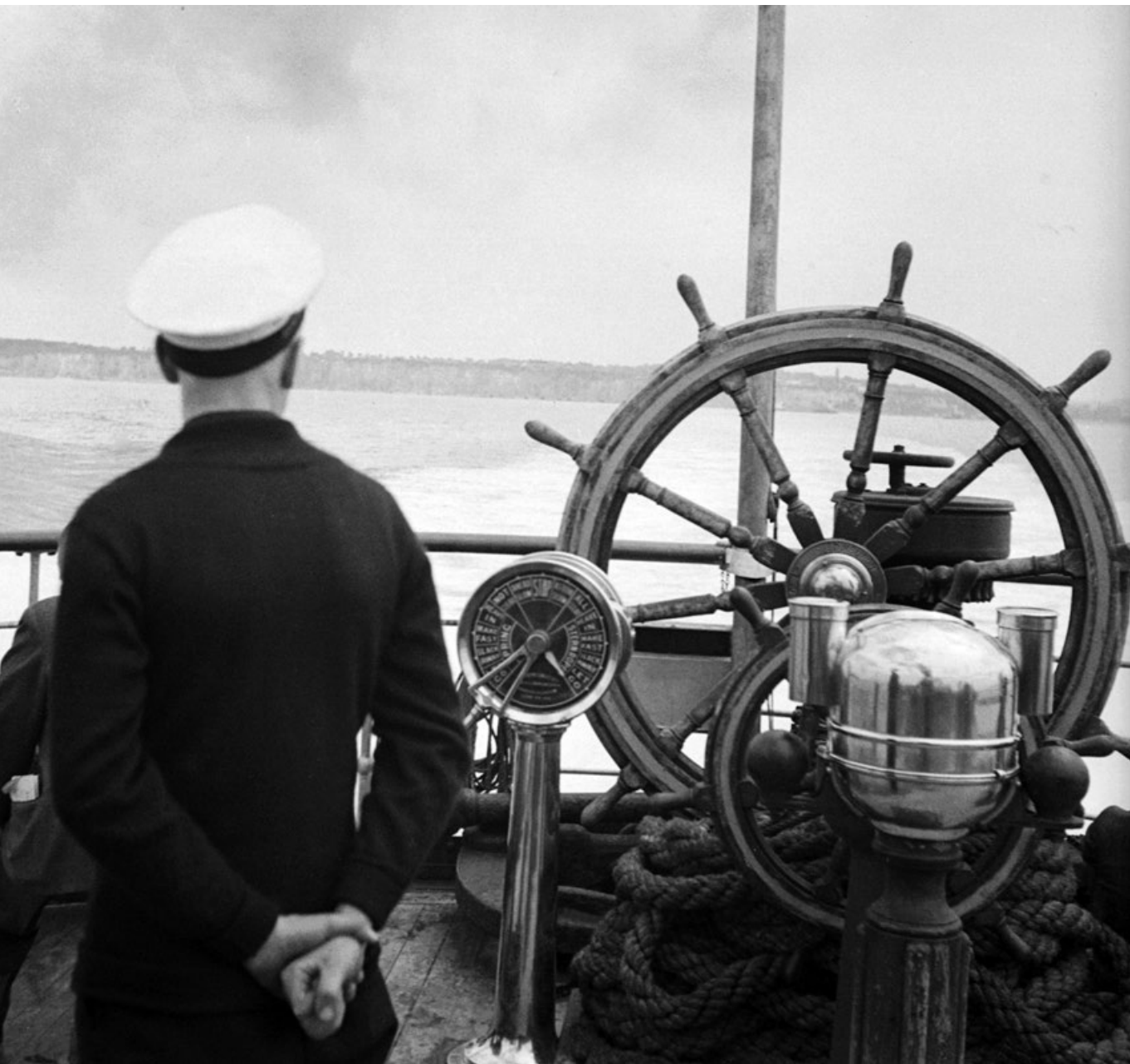
Kormányzástudás – A La Manche csatorna Dover előtt, 1939 (Fortepan)

erősített meg, drámaian átalakul. A mai hasonlít az 1815-ös bécsi kongresszus utáni világhelyzetre, amelyet versengő nagyhatalmak határoztak meg, de immár békét biztosító Szent Szövetség és nagyformátumú Metternichék, Talleyrandok nélkül. 2) Vége szakadt a neoliberális kurzus magabiztosságának, amely egyszerre jelentette a piaci fundamentalizmust és az államtalanítás gyakorlatát. A washingtoni konszenzus neoliberális hegemoniája a szemünk előtt repedezik, amikor privatizáció helyett az állam gazdasági szerepének visszatérését és protekcionizmust, szabadkereskedelem helyett védővámokat és gazdasági háborúskodást látunk. Mindez abba a világfolyamatba illeszkedik, amelyet a globalizáció megtorpanása, szerkezetének megroppanása és számos deglobalizációs jelenség kísér, aminek a nemzetközi szervezetekkel és egyezményekkel kapcsolatos szkepticizmus csak az egyik vonása. 3) Idehaza az 1990 és 2010 közötti posztkommunista korszak végét regisztrálhatjuk, amelynek bár gazdasági-politikai hegemoniája megszűnt, a szervesen hozzátartozó szívós liberális kulturális hegemonia viszont még fennáll. – Ebben a(z inkább) kedvező nemzetközi környezetben releváns a kérdés, hogy Magyarországon korszak lesz-e a rendszerből?