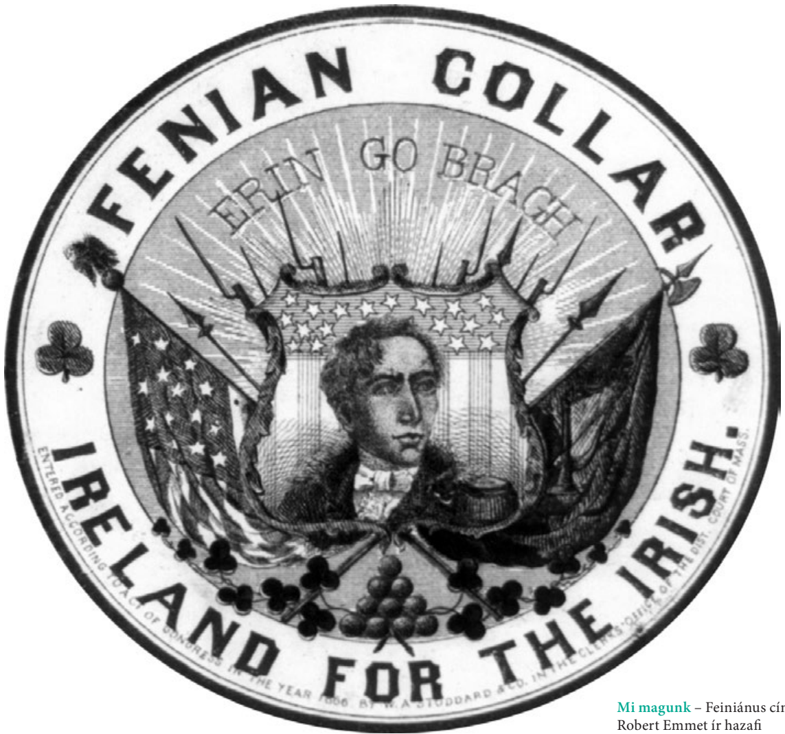
Mi magunk – Feiniánus címke Robert Emmet ír hazafi arcképével, 1866