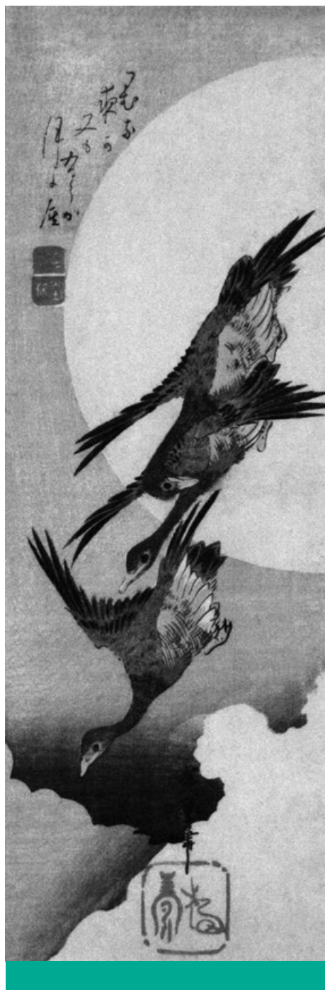
Organikus harmónia – Utagawa Hiroshige: Vadludak repülnek a Hold előtt (1832–35) (San Diego Museum of Art)

Az oikosz szó – melyből az „öko” előtag öröközte meg az „ökológia” (és más, hasonló) szavunkban – eredeti jelentése „otthon, háztartás, család”. Az etimológia megvilágítja, hogy a környezet- vagy természetvédelem valójában az otthon (haza) és a család védelme. Következésképp egyetlen családvédelmi program sem igen képzelhető el a természet és a társteremtmények védelme, az egészséges környezet megőrzése nélkül. Ezek szétválasztása nem a konzervatív, hanem a világ egységét dekonstruáló baloldali gondolkodás sajátosságaira utal. Mindebből az is következik, hogy az élelmiszeriparban alkalmazott, gyakorta egészségtelen adalékanyagok, a naponta használt mérgező vegyszerek, a természet használatának mai módzatai aláássák egy valóban konzervatív ökológia alapjait, mert a világ töredezettségéből fakadó ágazati logikában gondolkodnak, az összefüggéseket pedig elhomályosítják, a kölcsönös felelősséget elhárítják. A fragmentáltság logikája szerint a gyomirtók használata csupán az agrárium ügye; a vizek állapota a vízügyé; az erdőkért az erdőgazdálkodás felel; a városok levegőjének minősége városstratégiai kérdés; a biodiverzitás csökkenésének megakadályozása a természet-