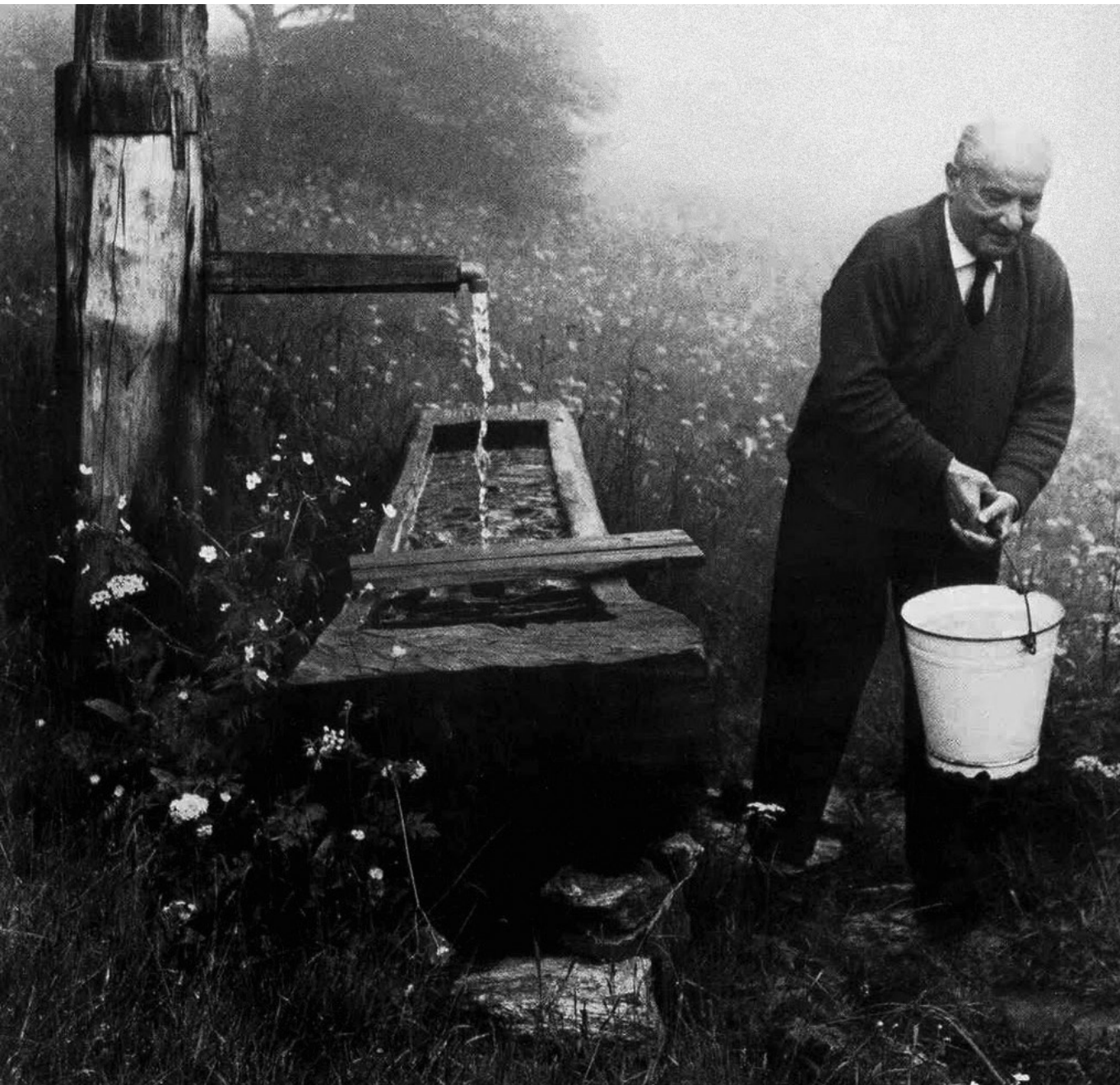
Létidő – Martin Heidegger vizet hord a Fekete-erdőben álló todtnaubergi házánál

nézzést negatív változást idéz elő, mert élőhelyeket szüntet meg (nem beszélve a felhasznált anyagok előállításának és utaztatásának költségeiről és környezetterheléséről). Az ilyen „környezetvédelem” azért nem ökológikus, mert „környezetkímélő” megoldásaival újabb problémákat idéz elő.