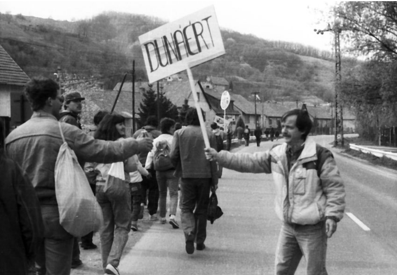
A Dunáért! – Ellenzéki menet a bős–nagymarosi vízlépcső ellen, Dunakanyar, 1989

hogyan alakulása után egy évvel, 1985-ben megkapta az alternatív Nobel-díjat. 27 Scruton, aki akkoriban közvetlen kapcsolatot tartott fenn számos közép- és kelet-európai ellenzéki mozgalommal, a Duna Kör-t a legjobban szervezett közép- és kelet-európai környezetvédelmi mozgalomnak nevezte. 28