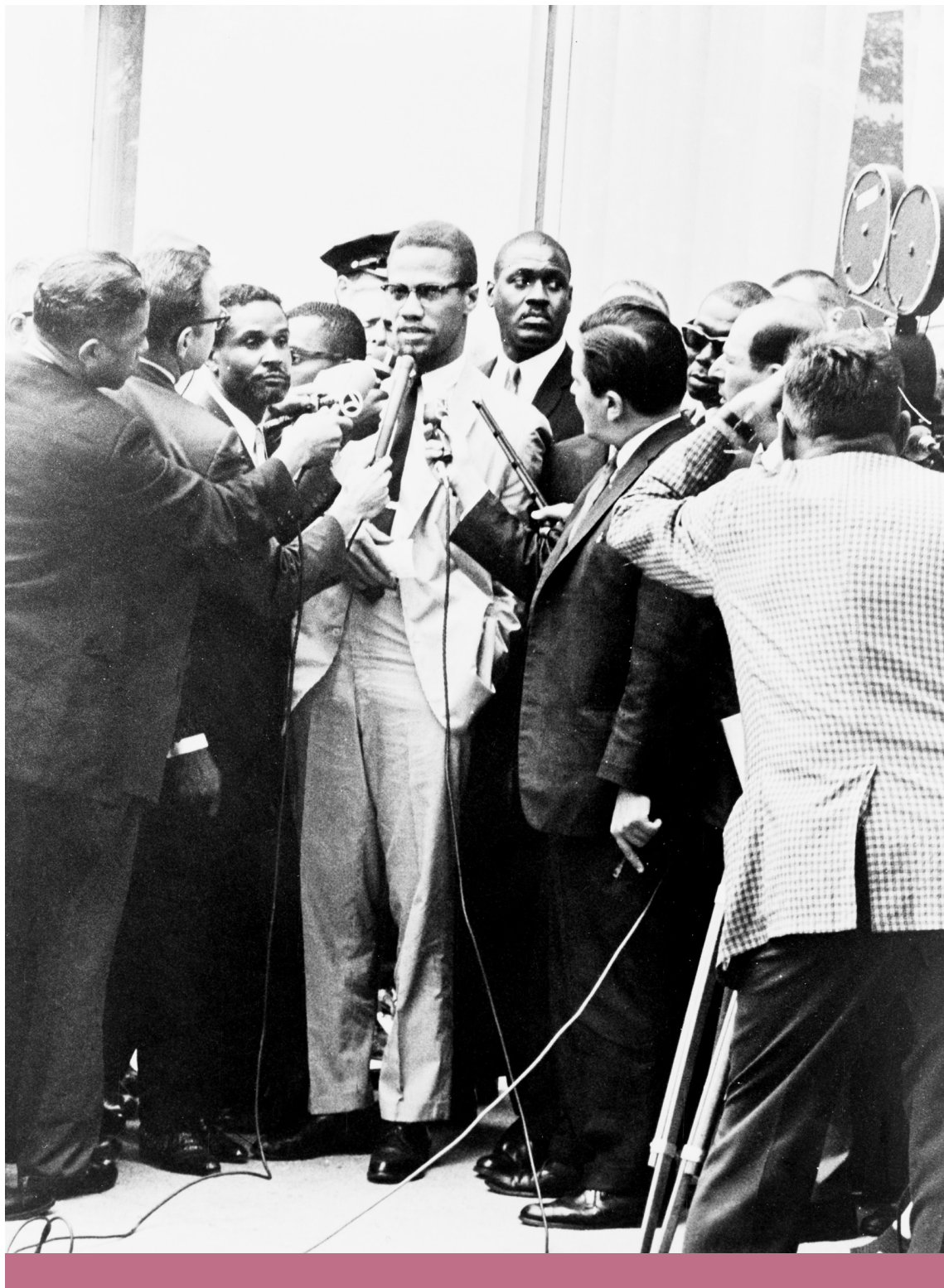
Állandó keresztűzben – Malcolm X nyilatkozik a sajtónak, 1964

azonban még súlyosabb ok volt, hogy Malcolm X fényt derített Elijah Muhammad házasságtörő életmódjára, amely feloldhatatlan ellentmondást jelentett idealista nézetei és a szervezet között. 25