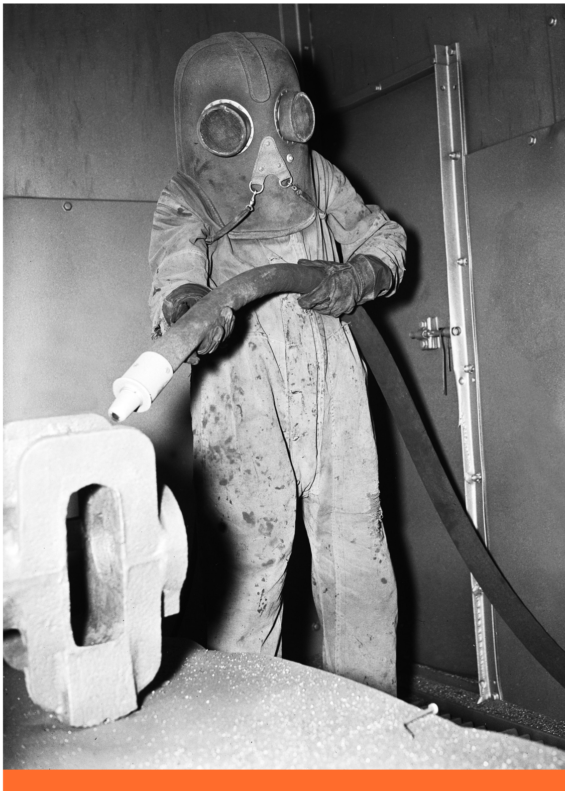
Technológiai világnézet – Amerikai munkás 1936-ban

szereti gyermekeit, dolgozik értük, hogy semmiben ne szenvedjenek hiányt; oktatja őket, arra tanítja, hogy legyenek becsületesek, hogy tiszteljék az Urat és az Úr napját. Ez az ünnepnap azt sugallja, hogy a valóság jótékony, méltó a beleegyezésre, a dicséretre. A heti misére járás ezt az alapvető hozzáállást erősíti. Megerősít minket abban, hogy a munkás, az iparos, a gazdálkodó több, mint egy „dolgozó”, akit megsemmisít a funkciója. És éppen ők a szemlélődésre szánt lények is (a templomok a közelmúltig elárasztották őket tanítással a képek és a szépség által). Mindehhez persze anyagi tényezők is szükségesek, például egy ház és egy kis földterület olyan iskola közelében, amely nem tolakodó (nem