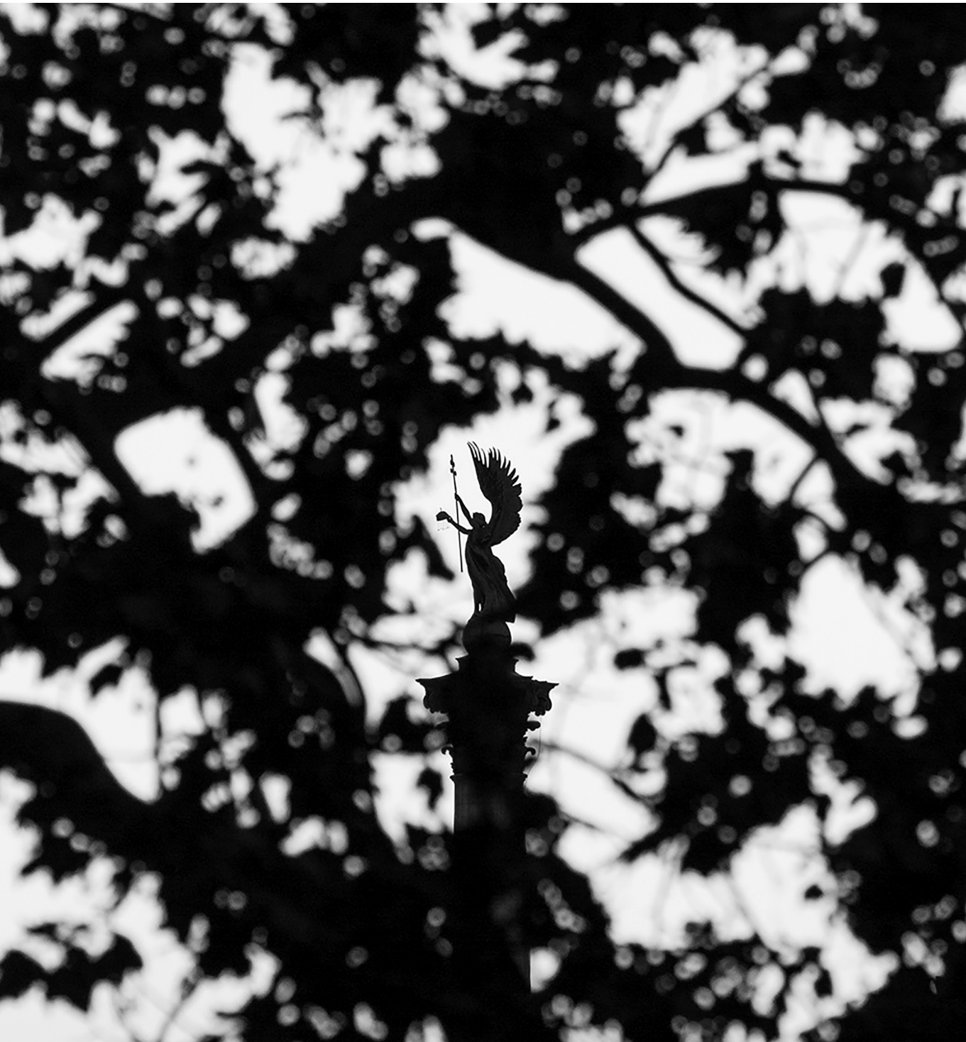
Keresztény távlat – Gábrriel arkangyal szobra a Hősök térén, 2020