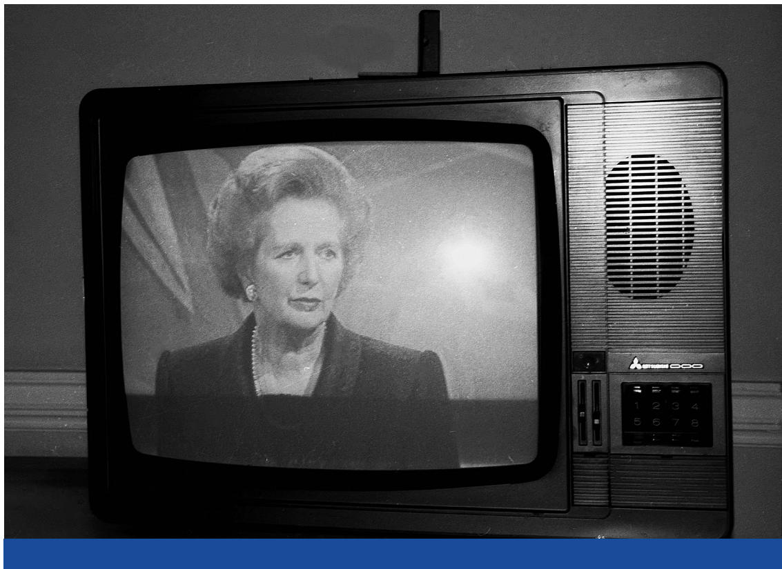
Neoliberális hullám – Margaret Thatcher 1990-ben