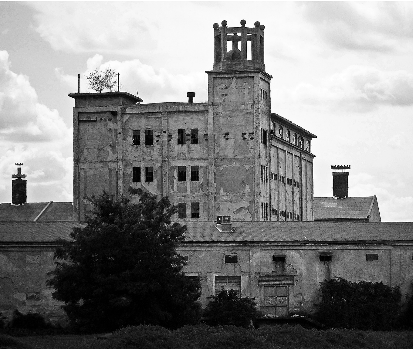
Gyár állott, most kőhalom – Lepusztult privatizált üzem épülete a budapesti Kőbányához tartozó Óhegy városrészben (Wikimedia Commons)

Az egyes pártok nemzeti arculata a kapitalizmus aktuális fejlődési állapotának megfelelő országspecifikus sajátosságokat hordozza. A '20-as évektől – a nagy gazdasági válsággal terhelt – időszakban Nagy-Britannia lesz a nem kommunista (de nem is bernsteini orientációjú) szocialista hagyomány élenjáró képviselője, Dél-Európában anarchista tradíciók színezik a képet, Olaszországban fasizálódás megy végbe, míg Skandináviában (Dániában, Norvégiában, Svédországban) a szociáldemokraták hatalomra kerülnek, s valamilyen formában tartósan ott is maradnak.