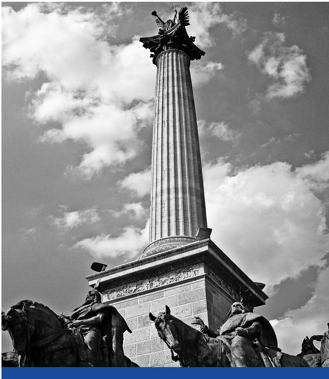
Államrend – A Hősök terén álló millenniumi emlékmű részlete, Gábrriel arkangyal szobrával

eme pályák elleni annyira hibáztatott avult előítéletei folytán juthattak – konkurencia hiányában – más osztálybéliek eme jövedelmező állásokhoz és kereshetethez, s így ez a – szerencsére szünni kezdő – előítélet reális szempontból csak nekik használt csupán a vezető osztályoknak ártott. Az ő elégedetlenségük nem is a gazdasági élet komoly, reális ellentétéin, hanem a társadalmi hiúság kicsinyes szempontjain alapul.