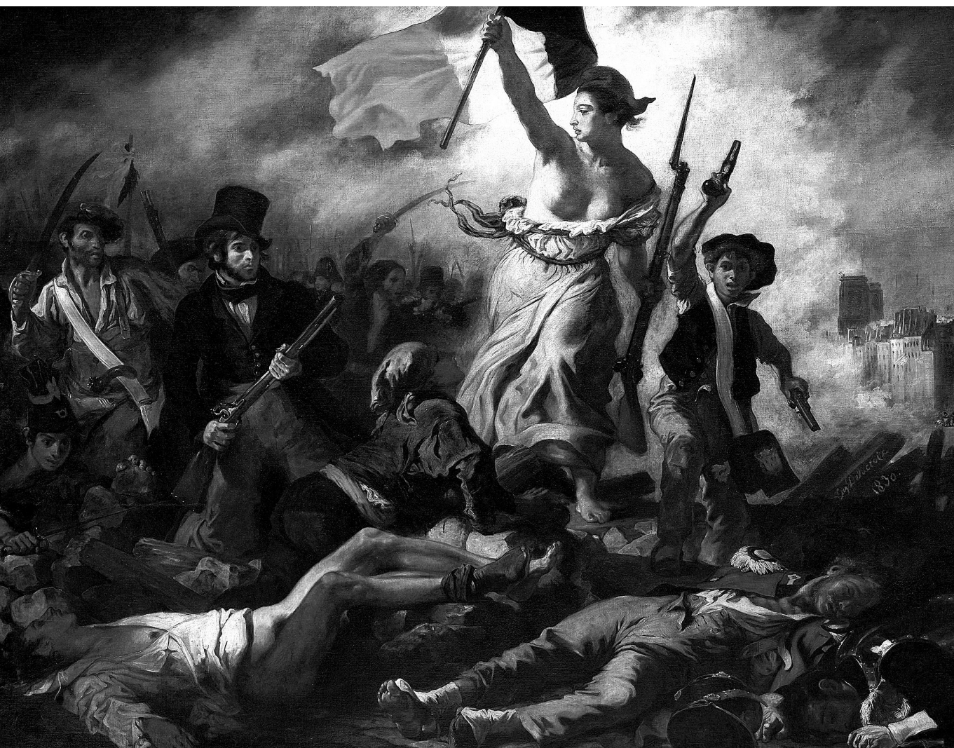
„Szabadság! Itten hordozák véres zászlóidat” – Eugène Delacroix: A szabadság vezeti a népet (1830)