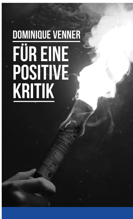
Dominique Venner: Pozitív kritikáért ([1962] 2017)

módszerrel lehet a legjobban átadni. Van egy probléma, amely alapjaiban fenyegeti a kontinens jövőjét – az ezt illető kritika mellé csatoljuk oda megoldási javaslatunkat is! Amikor a mozgalom 2017 nyarán egy közösségi adakozásból