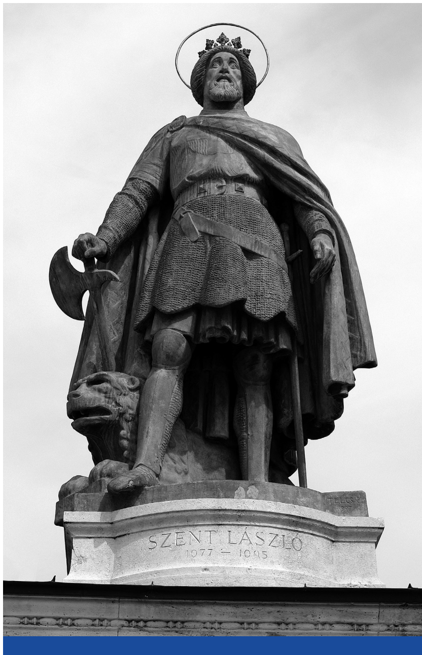
Keresztény állam – Szent László szobra a Hősök terén álló millenniumi emlékművön