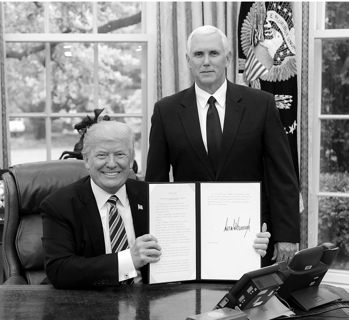
Új rend(elet) – Donald Trump amerikai elnök és Mike Pence alelnök a Fehér Házban, 2017

azok a nyugat-európai remények, amelyek egy esetleges Biden-gőzelem esetére a Clinton-féle '90-es évek vagy az Obama-éra Amerikáját várják vissza. Ezzel együtt egy Biden-adminisztráció vélhetően könnyebben megtalálná a közös hangot Amerika hagyományos európai és ázsiai szövetségeseivel, egyes globális kérdésekben – klímaváltozás, nemzetközi fegyverzetkorlátozás, ENSZ-szervezetek támogatása – pedig szorosabb tartalmi együttműködés is várható lenne közöttük.