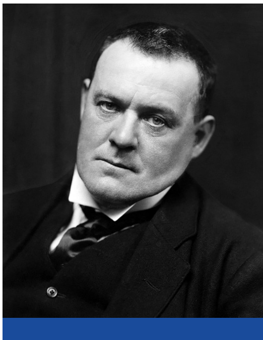
Hilaire Belloc (1871–1953)

Belloc nézete az volt, hogy a történelemben lényegében minden társadalom szolgai államot hoz létre, egyedül a keresztény intézmények tudták egy időre megakadályozni a szolgai állam kialakulását: „Érvem, miszerint a rabszolgaságot lassan átalakították, és hogy a régi pogány szolgai állam, a Katolikus Egyház hatása alá kerülve lassan megközelítette a disztributív államot, nem egy arra irányuló sajtósági védőbeszéd, hogy örömet szereznek felekezeti társaimnak. Ez egy egyszerű történelmi tény, amelyről mindenki saját maga is meggyőződhet.” 8 Belloc szerint ezt a lassú felszabadulási folyamatot megakasztotta a reformáció és a reneszánsz, a szolgai állam az „industrialista vagy kapitalista társadalommal pedig éppenséggel visszatér. Most éppen újra bevezetjük a rabszolgaságot.” 9