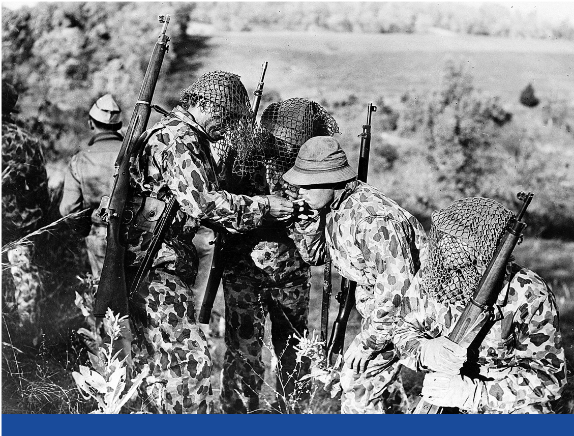
Álcázott művelet III. – Amerikai katonák terepszínű egyenruhában egy csendes-óceáni bevetésen, 1942 körül

birtokában szabadon kivitelezhetnek bumerángeffektust is. 43 Ilyenkor egy belső problémát, szintén NGO-közvetítéssel, nemzetközi szintre visznek ki, hogy „megnevezés és megszegényítés”, pontosabban „a szegény mobilizálása” 44 következze be, 45 amivel egy, talán épp a nemzetközi mainstream mel egyező változás kicsikarását remélik.