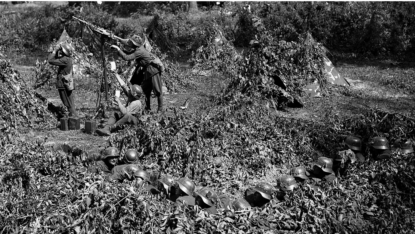
Álcázott művelet II. – Magyar légvédelmi géppuska körlete a keleti fronton, 1942

tetve egy friss írás éppen Goethe paradox gondolatát idézi: „leginkább az a rab-szolga, aki szabadnak tartja magát, miközben nem az.” 38