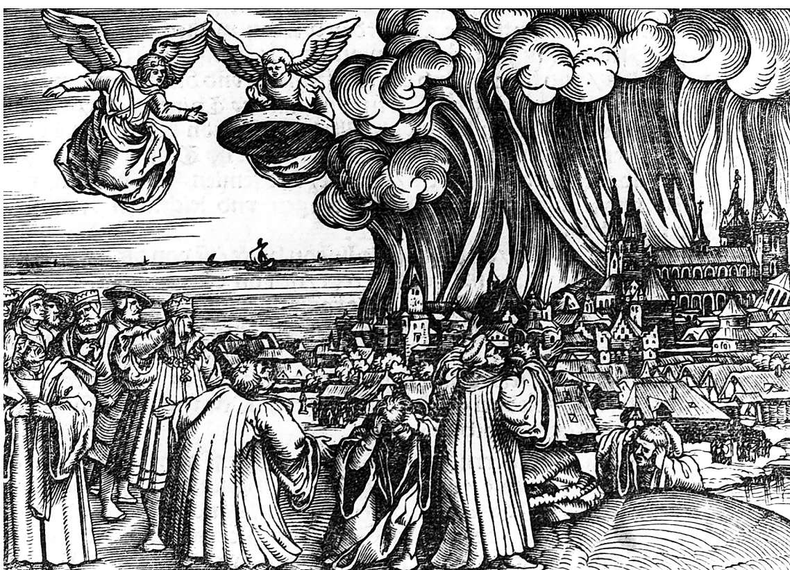
„Elesett, elesett Babilon” (Ézs 21,9) – Babilon bukásának ábrázolása a Luther-Bibliában, 1535 (Wikimedia Commons)

A következő két példám már közelebről érinti hazánkat. Nemrég történt, hogy Donáth Anna Júlia, a Momentum európai parlamenti képviselőjének egy informális, párton belüli beszélgetése nyilvánosságra került, melyből világossá vált, hogy ő és a pártja folyamatosan kapcsolatot tart a hozzájuk közel álló uniós biztosokkal és képviselőkkel, s az egész kapcsolatrendszer kifejezetten egy nemzetközi, globalista és liberális értékrendű hálózat jellegzetességeit mutatja. A végére hagytam azt a globalista, világot átszövő hálózat létezését bizonyító kisülést, melyet nem más, mint e hálózatnak az egyik, bár nem feltétlenül a legfontosabb hatalmi központja, csomópontja, azaz Soros György mutatott be. Az előzmény az Európai Bizottság panasza után az Európai Unió Bíróságának döntése volt arról, hogy a magyar felsőoktatást szabályozó 2017-es törvény – amelyik a liberális fősodor szerint a Soros által alapított Közép-európai Egyetemet (Central European University, CEU) hátrányos érintette – jogsértő, ütközik az uniós jogokkal. Ekkor a sikertől nyilvánvalóan felbuzdult bankár egy írásában szó szerint „felszólította” az uniót arra, hogy büntessék meg Magyarországot, a magyar kormányt, ami a korábbi Soros-nyilatkozatok és -írások alapján egyszerre jelentene jogok megvonását hazánktól, illetve kemény pénzügyi szankci-