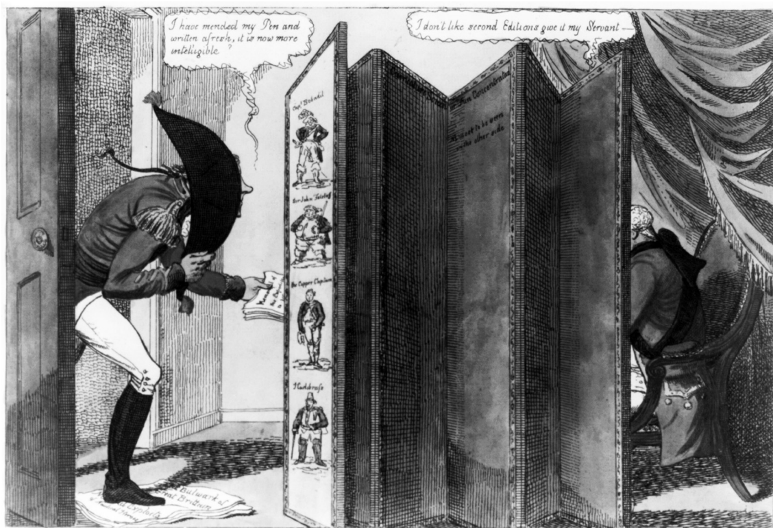
SECRET INFLUENCE, or a Peep behind the Screen.

Kulisszák mögött – „Titkos befolyás” III. György udvarában, 1810-es angliai ábrázolás