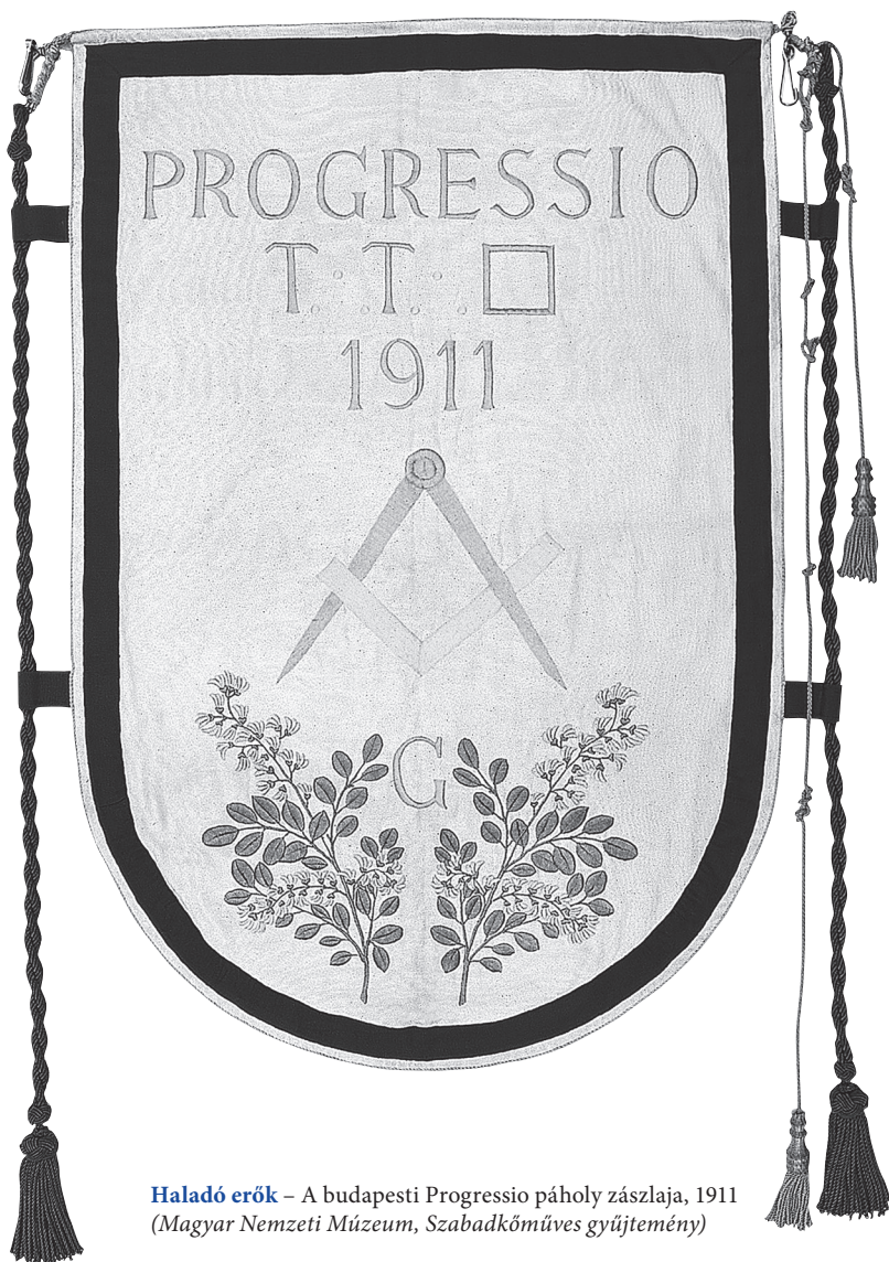
Haladó erők – A budapesti Progressio páholy zászlaja, 1911 (Magyar Nemzeti Múzeum, Szabadkőműves gyűjtemény)

Nem akarok itt belebocsátkozni annak jellemzésébe, hogy a sok szociális mozgolódás, annyi nyugtalan agitációs fészkelődés és lázongó népbarátság mögött sokszor milyen féktelen individualizmus bujkál, mennyi mérgezett egyéni ambíció lappang. Nem is tagadom, hogy a mi politikai és társadalmi viszonyaink szűk korlátai között sok igazolt érdek leszen sárba taposva, sok mélységesen emberi sóvárgás sajog kielégítetlenül. De kereshetjük bármerre a kibontakozás és boldogulás útját, tudnunk kell, hogy a nemzeti létnek alapeszméivel senkinek sem lehet könnyelműen experimentálnia. Minden nemzedéknek jut új és nagy munkája az ezeréves állam építése körül, de akik új államot akarnak építeni, legyenek tisztában azal, hogy itt sem telket kisajátítani, sem fundamentumot kiansni nem lehet. Már csak higgyék el, hogy ez a világ nagy Építőmesterének rendelése. ■