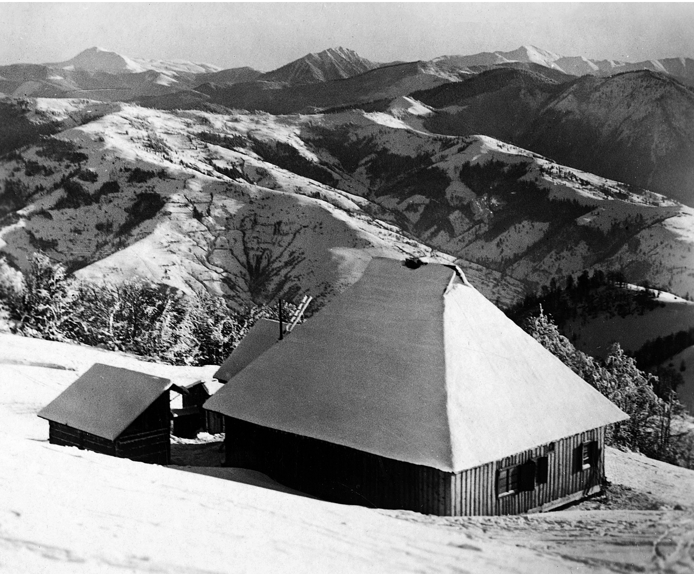
Közeli helyeken – Kilátás a kárpátaljai Rahóról a Máramarosi-havasokra, 1941

akkor érdemli meg a figyelmünket, ha létezik, ezzel szemben a baloldal a „még nem” létezőket kívánja emancipálni a fennálló valósággal szemben. Ennek az ellentétnek van egy utópisták számára kellemetlen mellékszöngéje, amit elveik fenntartása érdekében kénytelenek figyelmen kívül hagyni – jelesül az, hogy az idő önmagában nem létezik. A tér objektív realitás, míg az idő csupán a tér észlelésének egy módja, az emberi tudatba átvitt térbeli jelenség. 29 A forradalmár szereti azt hinni, hogy a teret az egyidejűség ritka pillanatai hozzák létre, és a világ különben egyedül a haladás törvényének van alávetve. De amiről beszél, az nemhogy nem szükségszerű – valójában nem is létezik. A baloldaliság ily módon kétségkívül „kiáltás a létező ellen, a nem tudható nevében”. 30 Akármilyen erősen szakadjon is föl ez a kiáltás, abban a valós térben visszahangzik, amely végső soron legyőzhetetlen, és mindig is a politika alapja lesz.