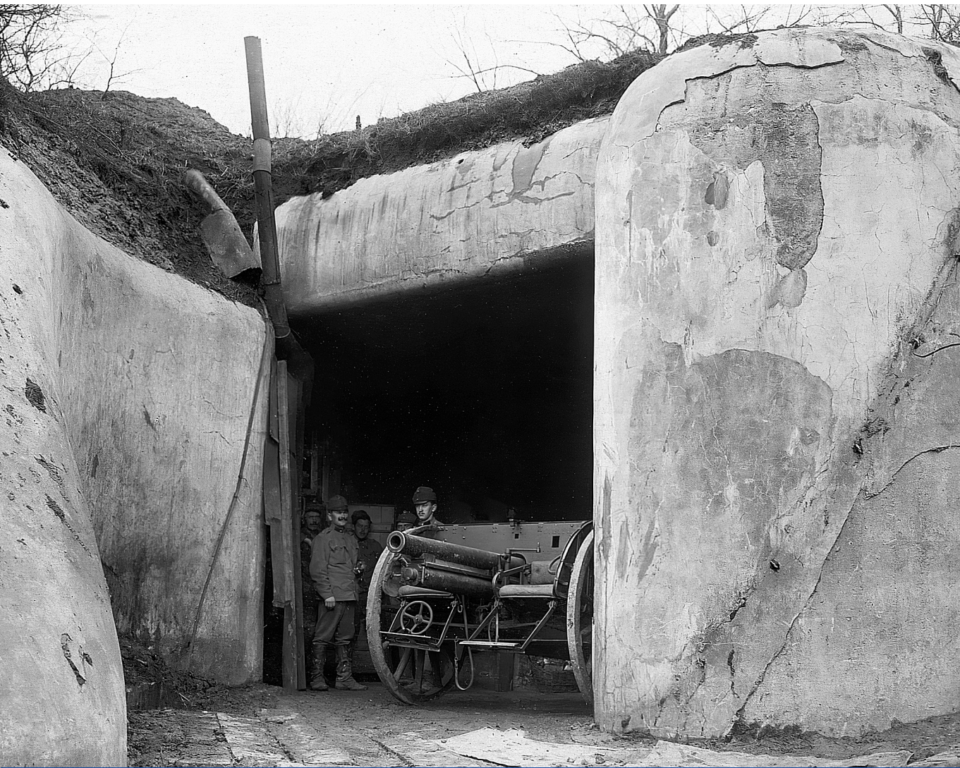
Helyőrség – A cs. és kir. közös hadsereg tábori lövege Tarakanov (Ukrajna) erődjének közelében, 1916

az idő ellentétét. 12 Ugyanezt az összefüggést ragadja meg Lukács György is, aki vehemensen küzd a gondolkodás minden formája ellen, amely „a tér nivójára süllyeszti” az időt. 13 Amikor szigorúan végigmustrálja az „imperialista korszak filozófiáját”, mintegy felüldülésképpen idézi Hegel egyik gondolatát, amely úgy tűnik, már a tér és idő „igazi” dialektikája felé mutat: „A tér igazsága az idő, így lesz a tér idővé; nem [...] szubjektív értelemben megyünk át az időre, hanem maga a tér megy át.” 14