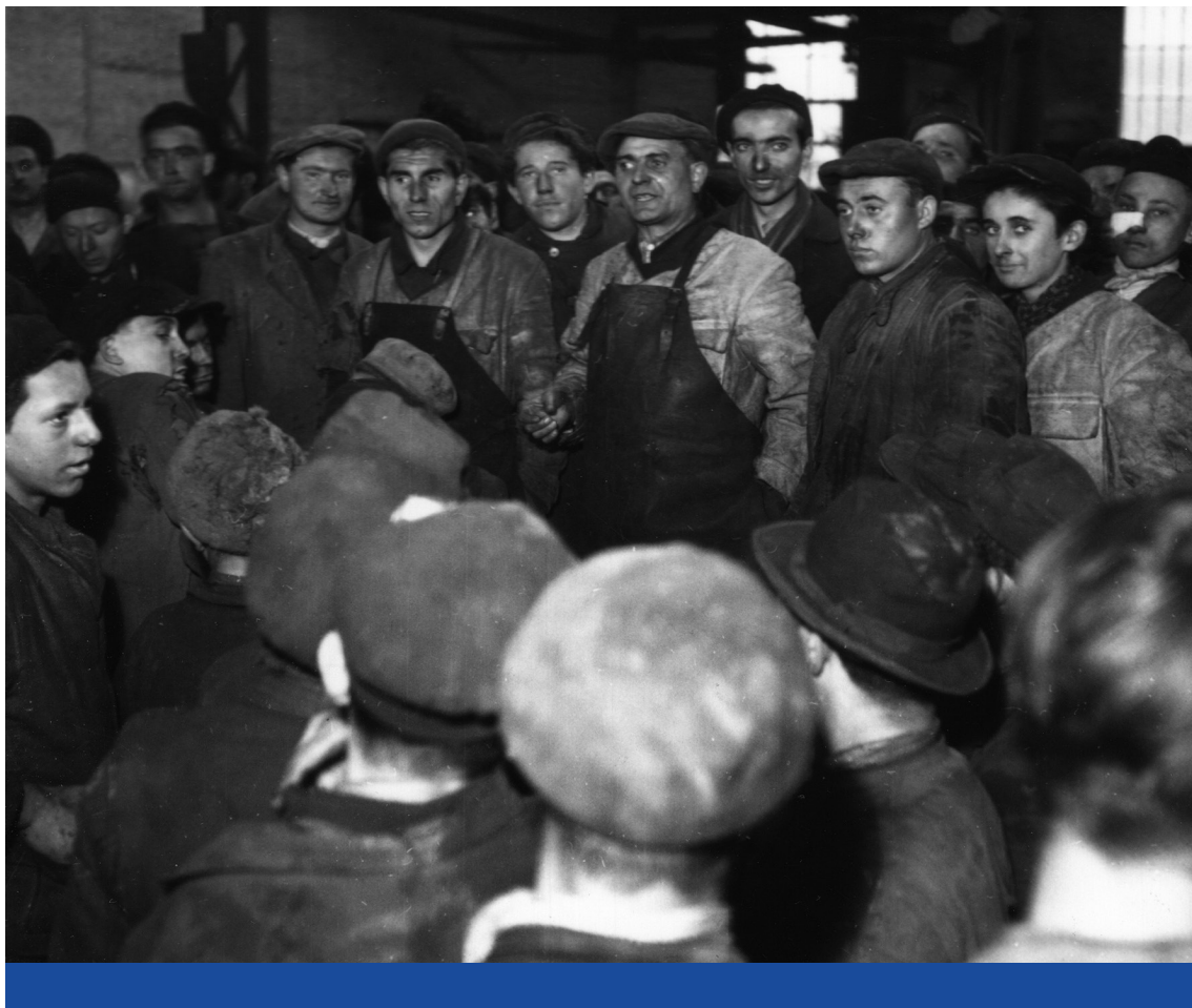
Térfoglalás – Kohászok munkásgyűlése, 1949

a posztmodern korszakot a végső veszélyeztettség időszakának élik meg, amikor az általuk képviselt eszmények, hagyományok és értékek teljes eltörlésére törnek a globális és progresszív erők. A posztmodern számukra a modernitás végítélete, amelyet minden rendelkezésre álló eszközzel meg kell akadályozni. A „nagy szétbomlás” tézise ugyanakkor, amely állítólag a hatvannyolcasok áldásos tevékenységével vette kezdetét, teljes félreértése a tényleges történéseknek. Utóbbiak szerint inkább a „nagy megsokszorozódásról” volna érdemes beszélni: a posztmodern kapitalizmus egyik legfontosabb hozadéka, hogy a profit elsősorban többé már nem a termelés (az értéktöbblet elsajátítása), hanem a fogyasztás (az extraporfit) oldalán realizálódik – tehát a siker alapvetően kulturális tényezőktől (logikáktól) függ. Ahogyan legutóbbi könyvemben ( Kívül/Belül – Egy új politikai logika. 2021) ezt részletesen elemzem: a tőke permanens forradalmat folytat a társadalom többsége azonosulásának elnyeréséért. A termékeket minél drágábban kell értékesíteni az állandóan telítődő piacokon, az újabb és újabb szolgáltatásokra, élményekre, tevékenységekre stb. vevőt kell találni, a célcsoportokat létre kell hozni és mozgásban kell tartani, a virtuális valóságokat étellel kell megtölteni, és el kell érni, hogy az emberek életmódja az állandó vásárlás köré szerveződjön. Mindennek eszköze és kerete a kultúra.