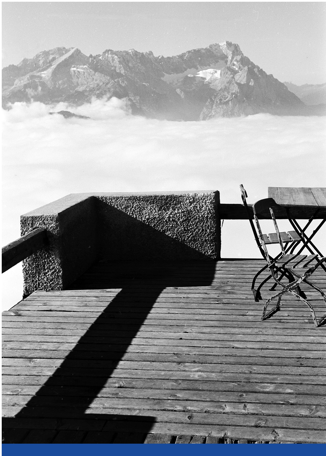
Végtelen tér – Kilátás az innsbrucki obszervatóriumtól a Hafelekar-hegyre

a szinglik elleni támadás egy olyan régi világ iránti nosztalgiára épít, amikor a férfiak még férfiak, a nők pedig nők voltak. Ahogyan Donald Trump a rozsdá-államok hajdani kékgalléros munkásait szólította meg sikerrel, a Brexit a kevésbé globalizált területeken volt vonzó, úgy Orbán az 1989 után sorsára hagyott magyar vidék méltóságát adja vissza.