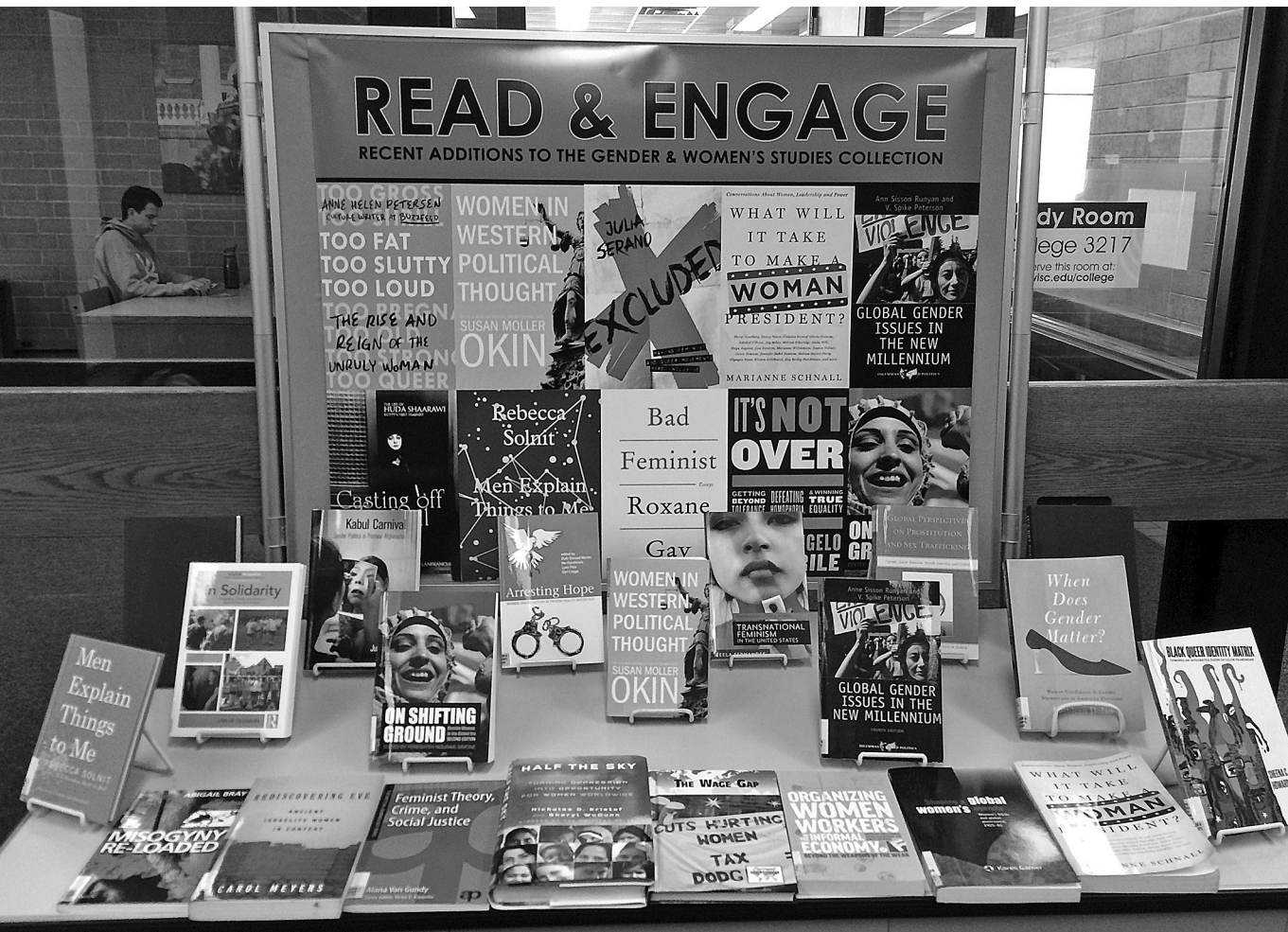
Hegemonia – Gender studies témájú kötetek a wisconsini Madison Egyetem könyvtárában (University of Wisconsin-Madison)

a magyarázatoknak a hitelességét, amelyek a szexuális különbséget és a nemek közti [kölcsonös – a Szerk.] egyenlőtlenségeket „természetes”, biológiai okokra vezették vissza. A genderfeminizmus vagy radikális feminizmus a nemek egyenlőségéért küzdő feminista mozgalmakból fejlődött ki a '60-as évek végén. 10 Meggyőződése szerint a történelem lényege az elnyomók és az elnyomottak közötti harc, a házasságot pedig a férfi és a nő közötti első antagonizmusnak tekinti. E szóhasználatot alapul véve és a marxista történetírást szemlélve, könnyen beláthatjuk, hogy a feminizmus és a marxizmus egyesítésének alapjait maga Engels teremtett meg, aki A család, a magántulajdon és az állam eredete (1884) című művében rámutatott arra, hogy „az osztályellentétek első megjelenése a történelemben egybeesik a női és a férfi antagonisztikus viszonyának kifejezésével a monogám házasságon belül, az osztályelnyomás első megjelenése pedig a nőknek a férfiak által történő elnyomásával.” 11