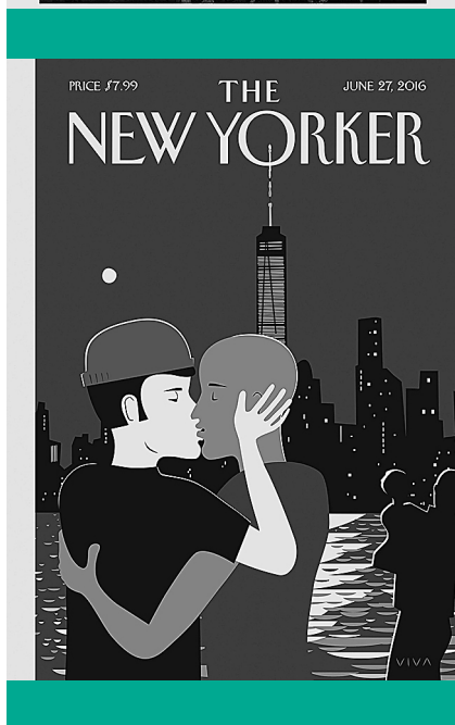
Globális propaganda – Különböző queer-identitásokat népszerűsítő nyugati magazinok címlapjai

EEJE-ben részes államok nemzeti jogrendszerei által lefektetett szabályok alapján lehet gyakorolni, amely lényegét tekintve az adott államnak a házasság társadalomban betöltött szerepéről vallott aktuális felfogását tükrözi, illetve annak függvénye. Az Európai Unió Bírósága az EEJE-vel összhangban szintén kimondta, hogy a tagállamok által általánosan elfogadott definíció szerint a házasság fogalma két különnemű ember egyesülését jelenti . Az Európa Tanács Parlamenti Közgyűlése 2000-ben 1474. számon ajánlást adott ki az azonos nemű párok helyzetével kapcsolatban, amelyben – a tolerancia erősítését aláhúzva – nagy fokú szabadságot hagyott a részes államok jogalkotói számára annak eldöntésében, hogy mikor, milyen módon és mértékben kapcsolódnak be a szabályozási folyamatba. A fenti rendelkezések alapján számos, az EEJE-ben részes állam az azonos nemű párok számára is lehetővé tette a házasságkötést, míg mások ezt a jogot csak a különnemű párok számára biztosítják.