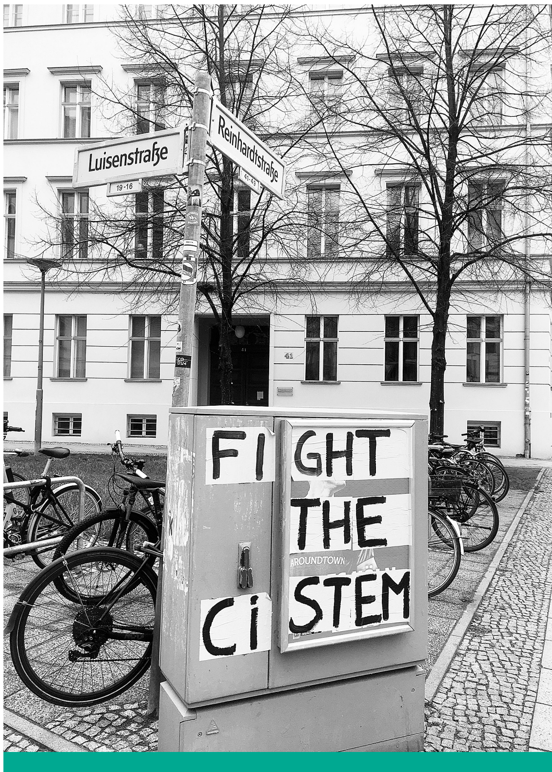
Nembináris – A két nem kizárólagossága elleni harcra felszólító graffiti Berlinben, 2021

számára a békét és jólétet. A marxista osztályellentét analógiájára alapozva a feminista ideológia jeles képviselője, Shulamith Firestone az ellentétek kibékítését a nemek közötti különbségek megszüntetésében látta. Álláspontja szerint „a nemi osztályok felszámolásának biztosítása szükségessé teszi az elnyomott osztály forradalmát és a szaporodás felett gyakorolt ellenőrzés megszerzését: a nők számára a saját testük fölötti rendelkezés visszaállítását, valamint az emberi termékenység női ellenőrzését, beleértve a modern technológiát és a gyermekszülés, gyermeknevelés társadalmi intézményeit is. Ahogyan pedig a szocialista forradalom célja nem csupán a gazdasági osztály privilégiumainak,