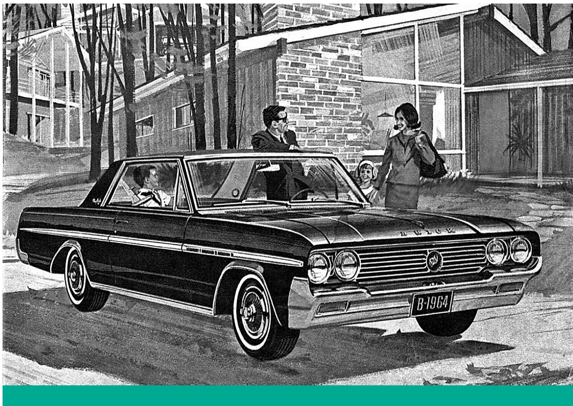
Régi rend II. – Buick-reklám 1964-ben

Összeségében megállapítható, hogy sem a nemváltó műtét, sem a hormonkezelés nem változtatják meg és nem is törlik ki a velünk született kromoszómaállományt, amely minden sejtünkben megtalálható, s mint ilyen meghatároz bennünket. A hormonkezelésen vagy nemváltó műtéten átesett személyek természetes utódnemzésre alkalmatlanná válnak, következésképpen esetükben a gyermekvállalás csak örökbefogadás vagy béranyaság útján jöhet létre. Viszont azt is hangsúlyozzuk, hogy ezek a kezelések viszonylag újak, így azok mellékhatásairól nem rendelkezünk elegendő tapasztalattal.