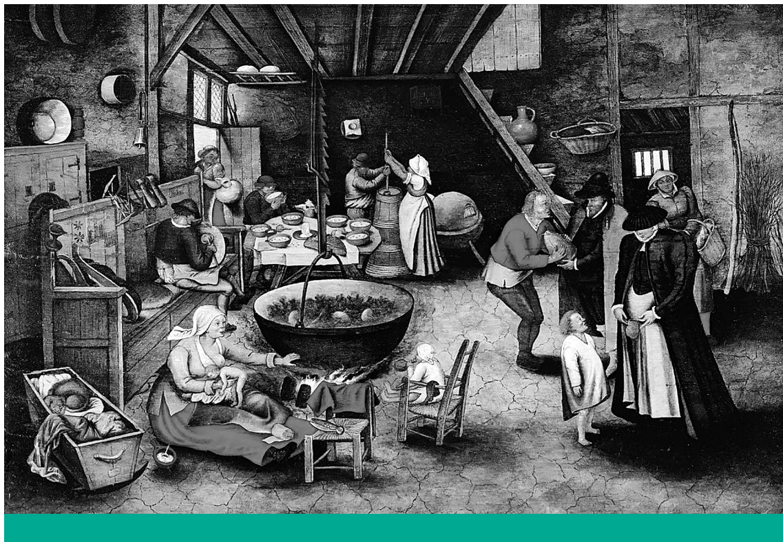
Régi rend I. – Ifjabb Pieter Bruegel Látogatás a parasztgazdaságban (1622) című festménye (Wikimedia Commons)

egészségi eredményekhez kapcsolódik”, így „orvosi szakértők szerint a döntésnek valószínűleg katasztrofális következményei lesznek a transzfiatalok mentális egészségére”. 24 A transz nemű jogvédők szintén felháborodtak a döntésen, és elítélték a törvényjavaslatot, mondván, hogy az „veszélyeztetné a transz nemű gyermekeket”, ugyanis szerintük „elszörő bizonyíték van arra, hogy a transz nemű és nembináris fiatalok identitásukban való megerősítése csökkenti az öngyilkossági kockázatot, és javítja az egészségüket is”. 25 Táborukat sajnálatos módon sokszor maguk az egészségügyi szakemberek is gyarapítják, akik a nemi identitás zavarban szenvedő gyermekek szüleit a kezelések elfogadására buzdítják. 26 Mindezek ellenére további 16 állam veszi fontolóra az arkansasihoz hasonló döntés meghozatalát.