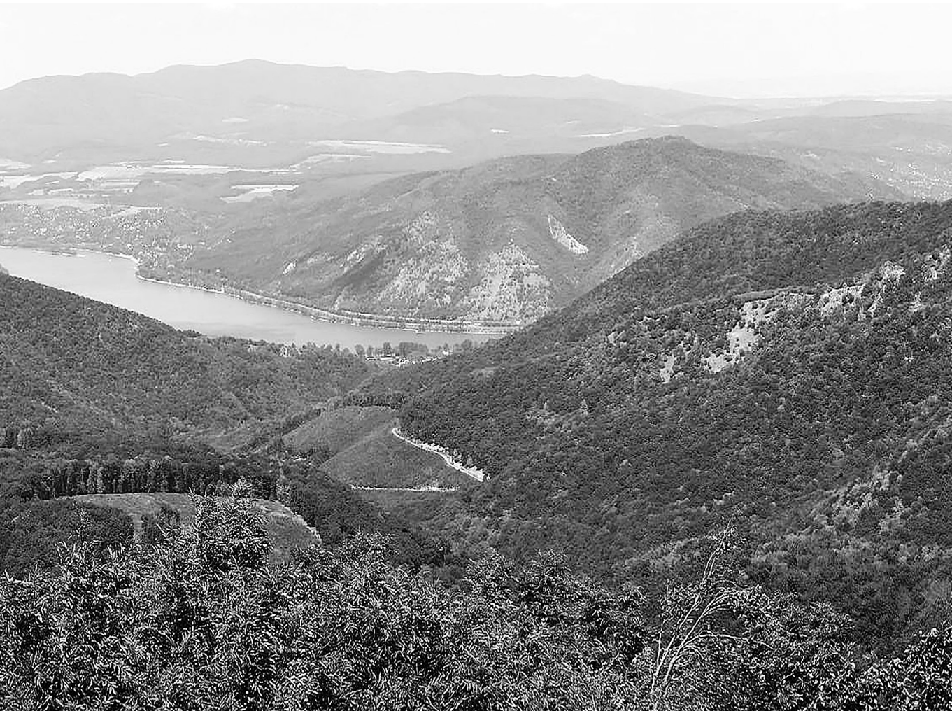
Közép-európai horizont – Kilátás a Dobogó-kőről a Duna-kanyarra

arra is, hogy fenntartható növekedési pályára állítsa a nemzetgazdaságot és megakadályozza egy újabb válság kialakulását, illetve globális válság idején megakadályozza, hogy versenytársainkhoz képest jobban kiszolgáltassa annak az országot. És ez a stabilitás adta az alapot a nemzetpolitika újjáépítéséhez.