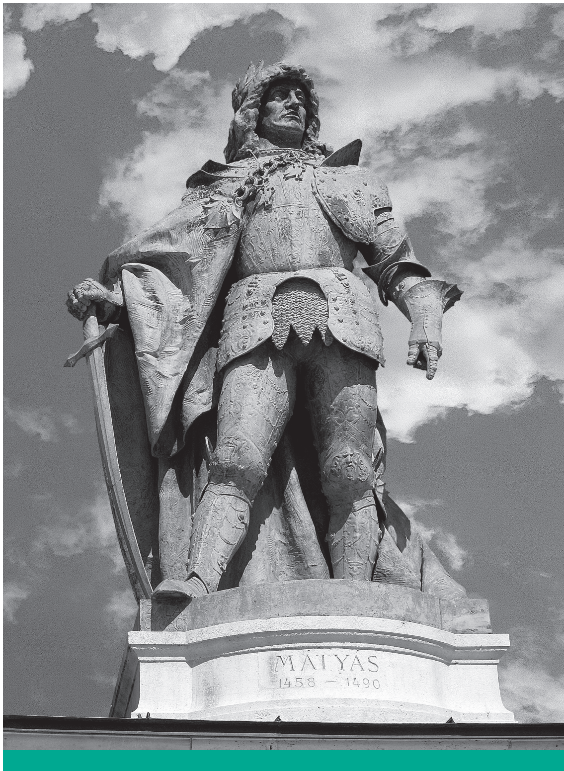
A fejedelelem – I. Hunyadi/Corvin Mátyás szobra a millenniumi emlékművön

lektív akaratnak, amely létrehozza az „új államot”, s ezáltal válik a történelmi dráma főszereplőjévé. Amint olvassuk is: „Az új fejedelelem, a fejedelelem mint mítosz nem lehet valóságos személy, konkrét egyén; csak szervezet lehet; összetett társadalmi elem, amelyben máris konkrét formát kezd öltetni a cselekvésben felismert és részben érvényre jutó kollektív akarat. Ezt a szervezetet már létrehozta a történelmi fejlődés, s ez a szervezet a politikai párt”. 28