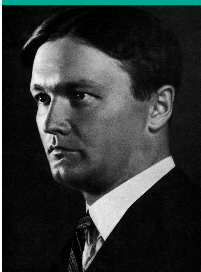
Az önállóság útján – gróf Zrínyi Miklós, gróf Széchenyi István, Németh László (, Németh László munkái: Az én katedrám. 1983)