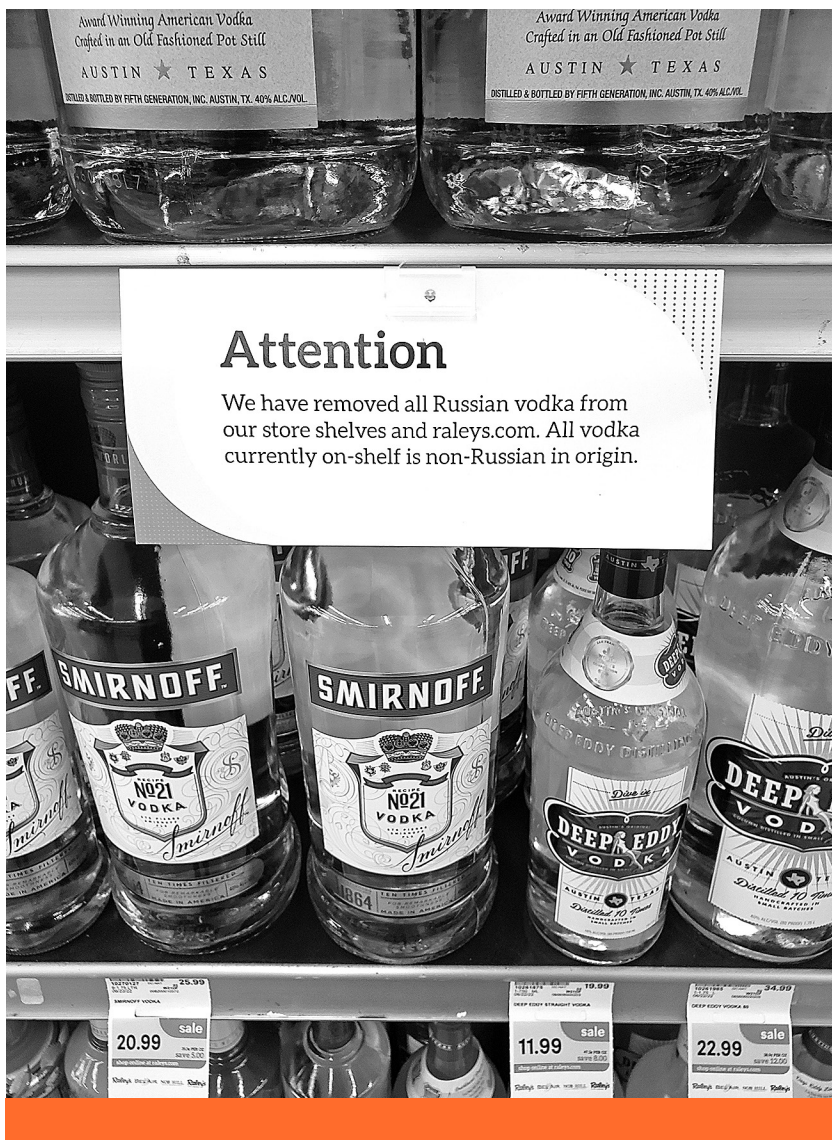
Mámoros állapot – Orosz vodka kitiltása a Raley’s szupermarketből, Roseville (Kalifornia), 2022. június 9.

politikai paradigma érvényesítése értékpolitikai szempontok alapján is igazolható, vagyis a világpolitikai folyamatok körültekintő értelmezése nem nélkülözheti az értékpolitikai paradigmát, csak megfelelő tartalommal kell azt feltölteni!