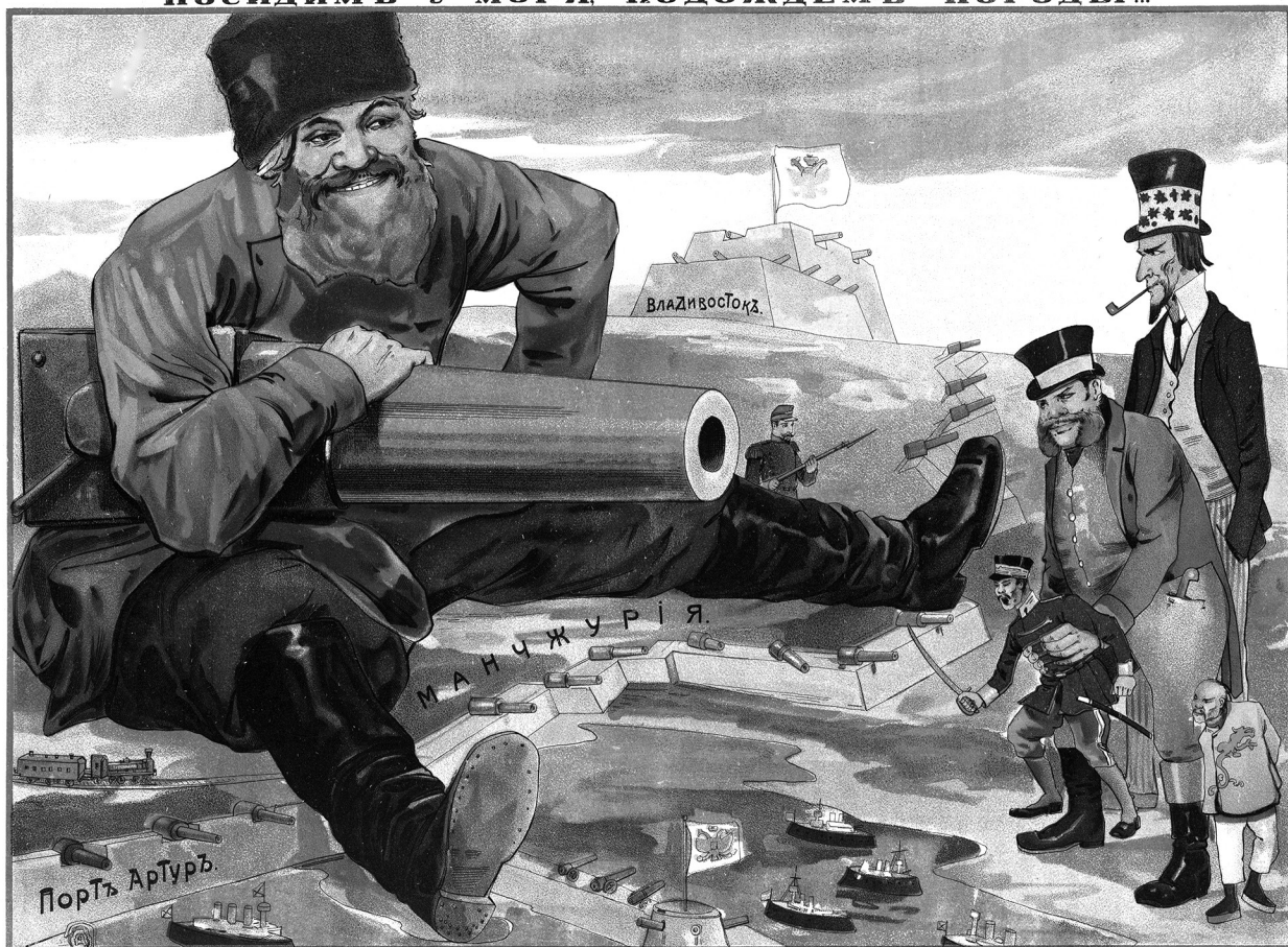
Детское искусство. Москва. 18 по февраль 1904 г.

Посидимъ у моря, подождемъ погоды! Видишь, —какіе страшные уроды выдвигаются изъ за Японской сѣткы! Должно —быть, это —оно опекунъ!.. Загорелые покровители!.. Покуривши, соскочи, на газитте-ты —нашей русской лагорочки, что виднѣтся на горочкѣ!.. А это —тебѣ, Японецъ, иеру-