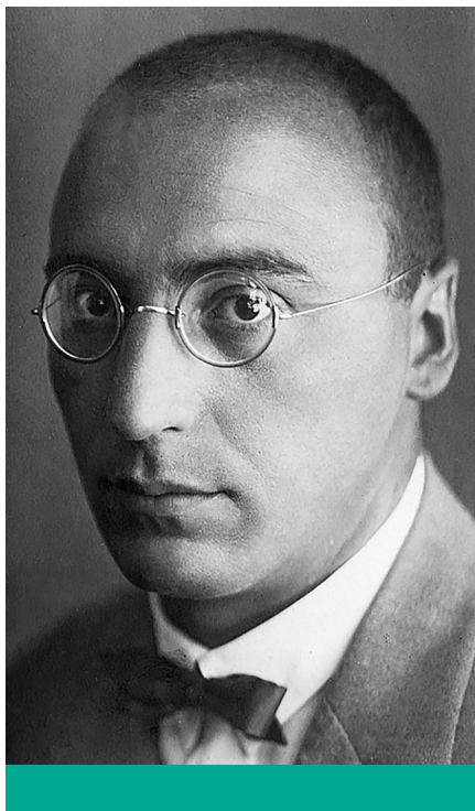
Edgar Julius Jung (1894–1934) 1925-ben