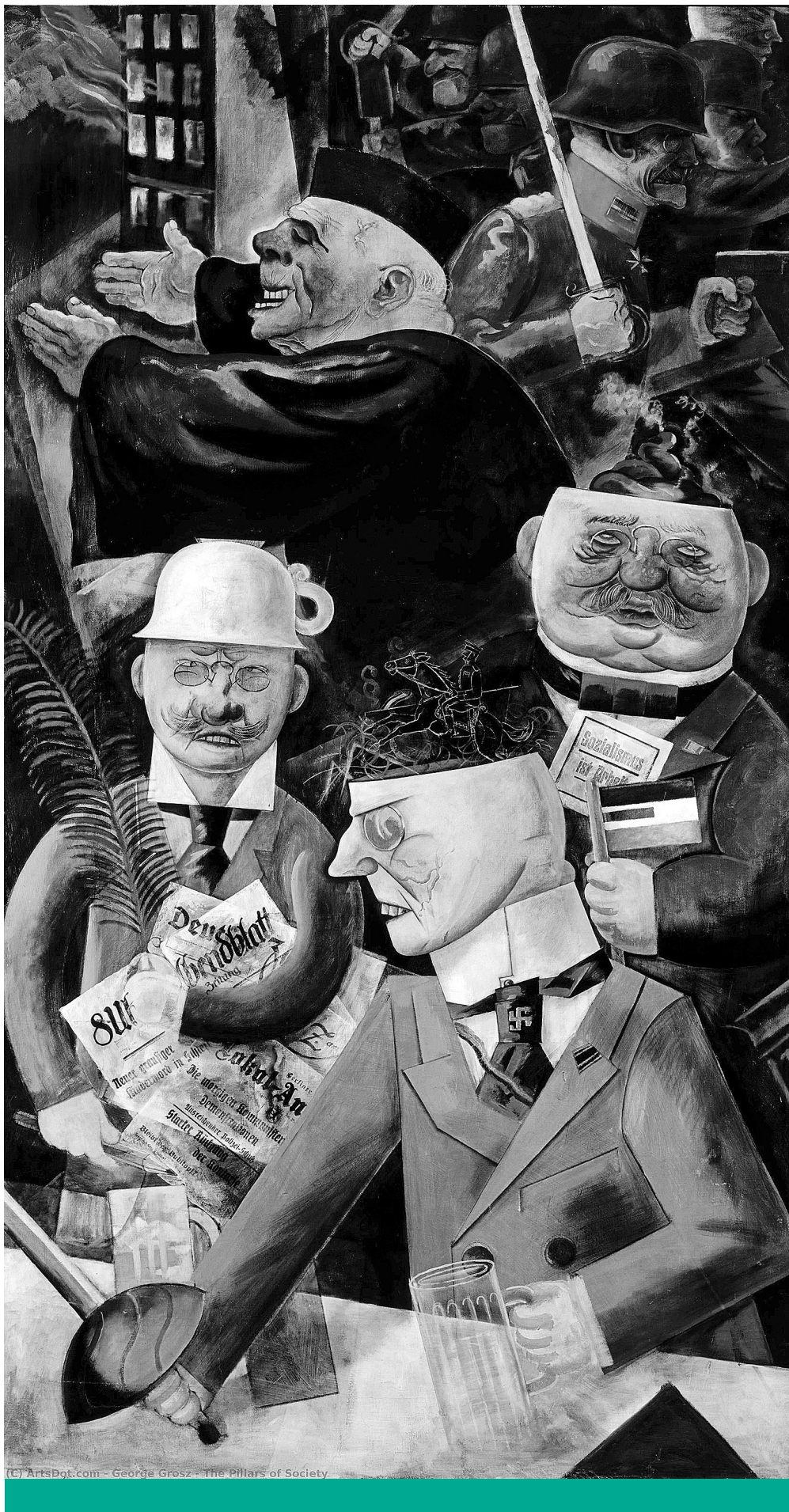
George Grosz - The Pillars of Society.