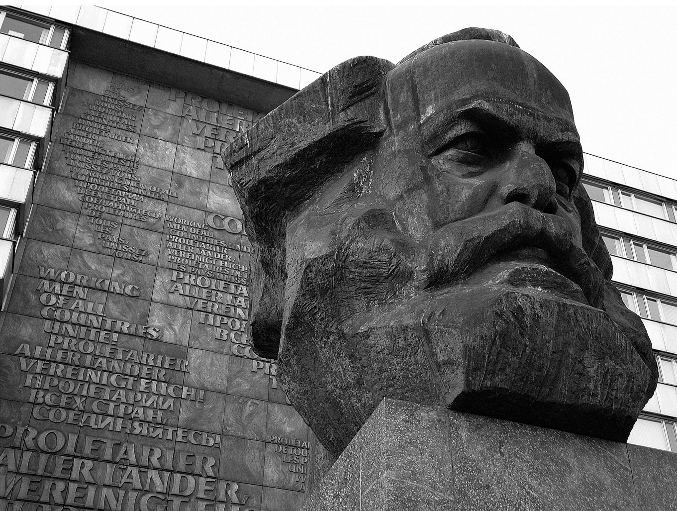
Baloldali tömb – Marx emlékmű Chemnitzben

van, ahol regnál még (Észak-Korea, Kuba, Laosz, Vietnam), méretebb társadalomszervezői mivoltában azonban elenyészik, amit a felületes látszat ellenére nem cáfol Kína példája sem, sőt.