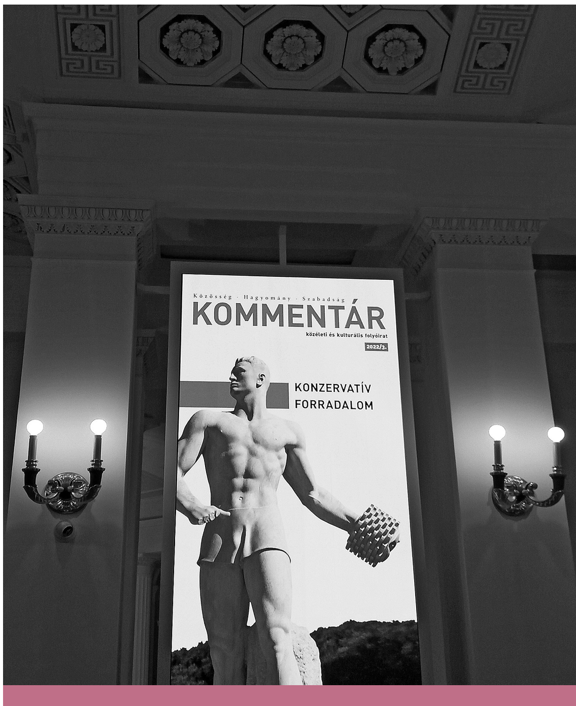
Forradalmian konzervatív – A Kommentár folyóirat 2022/3. lapszámának bemutatója a Magyar Nemzeti Múzeum előcsarnokában, 2022. szeptember 28. (Békés Márton felvétele)

a lap „világnézetünk alapkérdéseit frissíti fel”, öt pontból álló feladata pedig az, hogy „a szellem igényeit megfigyelje”, miközben „a ma szellemi tájképe mögött számon tartja a geológiai erőket, a múltat”, aztán valóságos „új enciklopédiát” hozzon létre a részismereteket szintetizáló „összefüggő tanítással”, ezen kívül „figyeli a társadalom életét és a tömegmozgalmakat”, végül pedig „a magyarság »szerepét« keresi; létezése tényén túl értelmet a létezéshez”. 40 A nagyívű vállalkozás szellemi horizontja kétségtelenül világot átfogó volt, fókusza viszont magyarcentrikus. A második évfolyamban a folyóirat munkatervét megfogalmazva azt írta, hogy kezdettől fogva „ott lappangott benne kultúránk új, nemesebb szervezete”, hazai és közép-európai viszonylatban egyaránt. 41 Ezt a feladatvállalást a Tanú nemzedéki társfolyóiratának is felfogható, 1934-ben