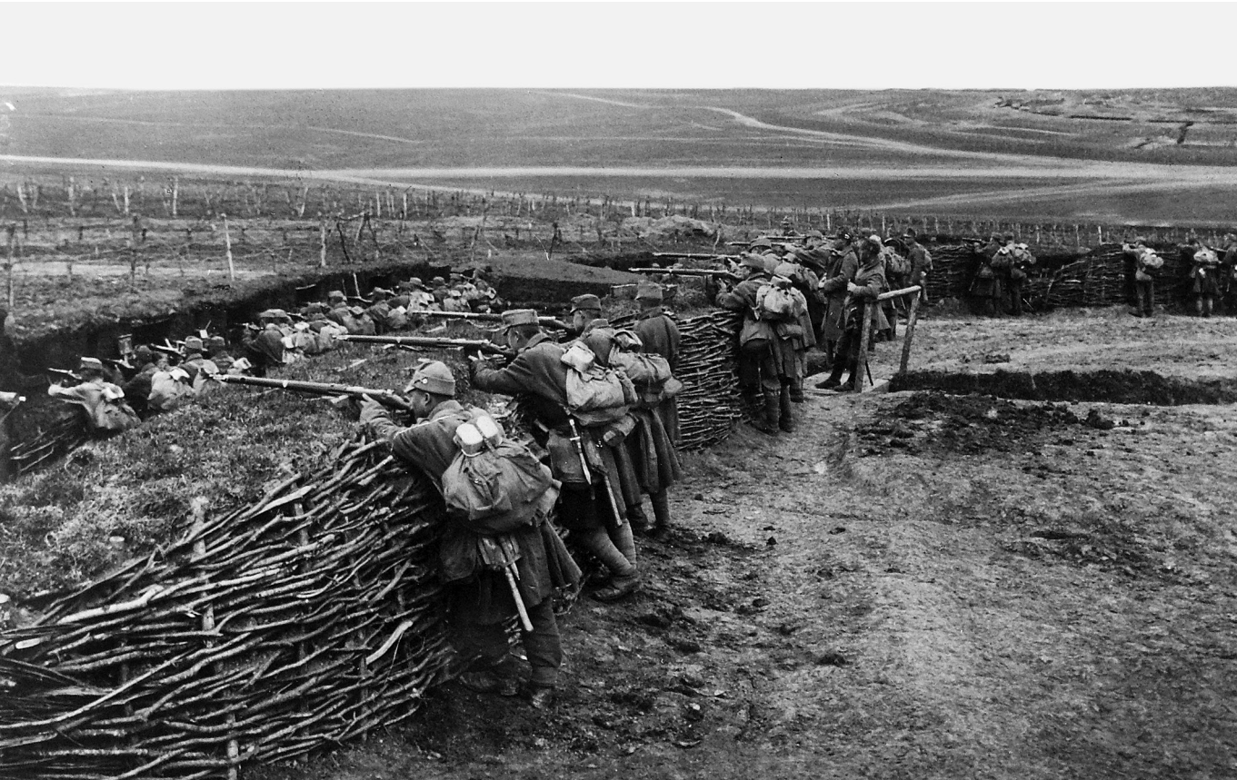
Mélyégi védelem – Osztrák–magyar lövészárak az I. világháború keleti frontján, 1916

Mindez nagyon hasonlít a szárazföldi csapatok védelmi harctevékenységének fölépítésére, ahol az erők 50-60 km mélységben helyezkednek el, több lépcsőben egymást mögött, utánuk a tartalékkal. Miután „minden politikai harcnak megvan a maga katonai magva” (Antonio Gramsci), nem túlzás ehhez a mélyégi védelemhez hasonlítani a kulturális hadviselés egyébként inkább támadó jellegű szervezetrendszerét.