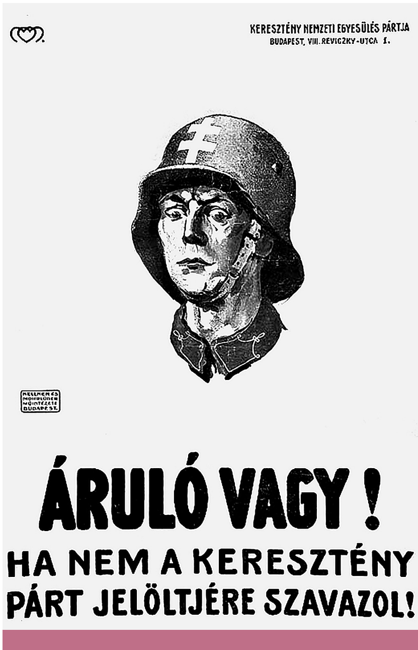
Nyugtalan erő – A Keresztény Nemzeti Egyesülés Pártjának ellenforradalmi választási plakátja 1920-ban

nap után a helyi egyetemi ifjúság szélsőjobboldali tagjait nevezte meg fő gyanúsítottként a sajtóban, ám a források eltérnek azzal kapcsolatban, hogy végül jutott-e bármire a nyomozás. 62 Az esetet követően viszont a lapok rögtön találgatásba kezdtek a tettesek kilétét illetően, egyértelműen utalva arra, hogy mivel a keresztények közt nincs „lényegbeli” különbség, nyilván egy „kívülálló harmadiknak” állt érdekében a templomgyalázás. 63 A Vas vármegyei evangélikusok lapja a határon átszivárgott románokra gyanakodott, 64 mások – így a Hubert-hez köthető Debreczeni Újság – viszont kimondatlanul a zsidókat okolták a „mérényletért”. 65 Nem sokkal a templomgyalázást követően látszólag református szemszögből íródott, ám látványosan zsidó fogalmakat használó röplapokat osztogattak a debreczeni utcákon. A pamflet felszólította a reformátusokat, hogy „üsd [...] az álkeresztény tisztí bitangokat”, ám látványosan a „hitközség” szót használta a református egyházra. 66