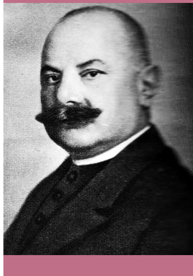
Protestáns oldal – Raffay Sándor, a Bányai Evangélikus Egyházkerület püspöke és Baltazar Dezső, a Tiszántúli Református Egyházkerület püspöke (Wikimedia Commons)