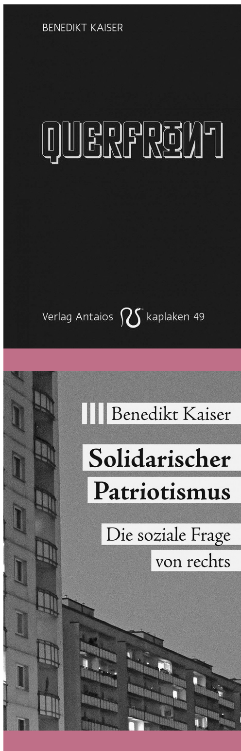
Benedikt Kaiser két nagy hatású könyve, a Keresztfront (2017) és a Szolidáris hazafiság (2020)