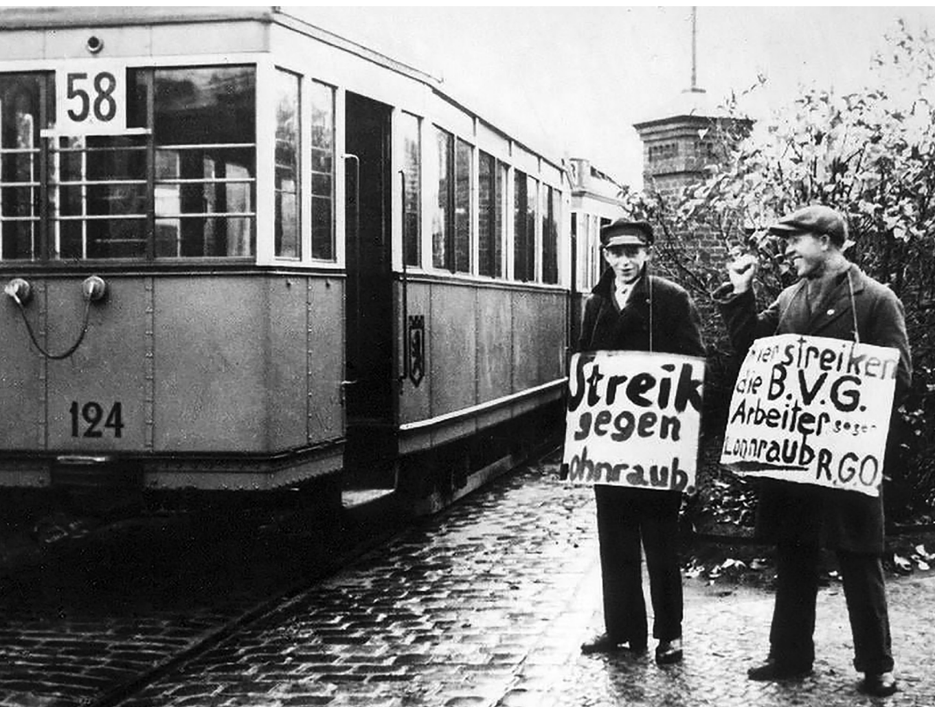
Keresztfront – A bal- és jobboldali szakszervezetek közös közlekedési sztrájkja Berlinben, 1932. november (Bundesarchiv / Wikimedia Commons)