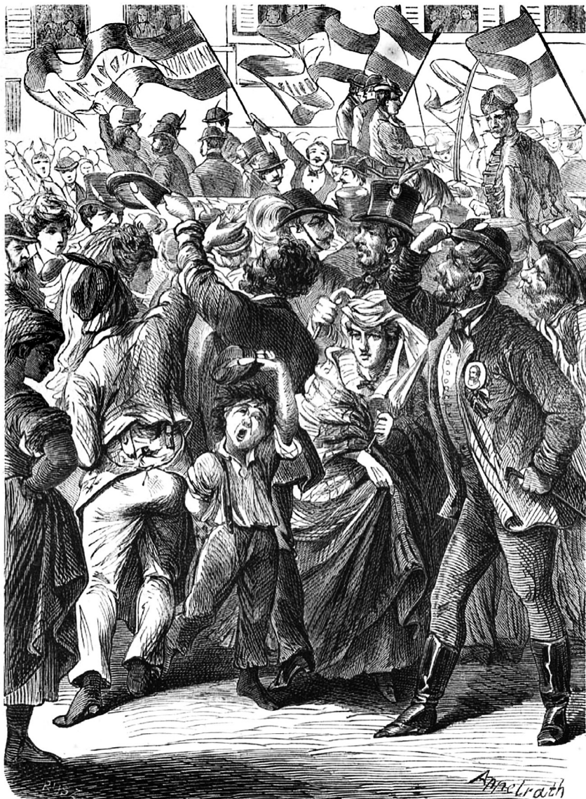
Korteshadjárat – Ludwig Appelrath rajza Jelenet a pesti választások alatt címmel a Vasárnapi Újságban (1872. évi 26. szám, 316. oldal)