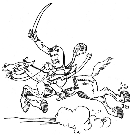
lehet fej nélkül, —