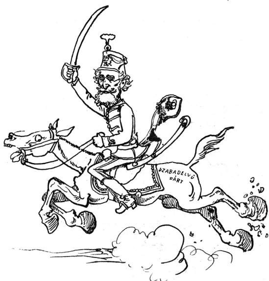
A lovas lehet a maga fejével, —