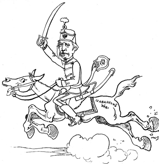
lehet a más fejével: