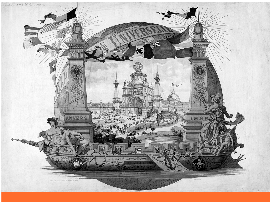
Nyugati univerzum – Az antwerpeni Nemzetközi Kiállítás plakátja 1885-ben (Library of Congress)

legproblematisabb fejleménye nem a Kenyában vagy a Fülöp-szigeteken tapasztalt valamiféle „demokratikus visszaesés”, hanem az olyan régóta működő demokráciákkal szembeni nyilvánvaló elégedetlenség, mint Franciaország vagy az Egyesült Államok. 13 Ugyanakkor, bár a demokrácia mint politikai berendezkedés évezredek múlta tekint vissza, két egyforma demokrácia még sosem fordult elő a világtörténelemben. Mindennek fényében játszik kimagasló szerepet az adaptálódás képessége, ugyanis a demokráciáról alkotott koncepcióból mindig hiányozni fog az a fajta demokrácia, amelyet még nem éltünk meg. Vagyis egy dolog biztosan állítható: a liberális demokrácia nem a fejlődés végpontja, a kormányzás végső formája.